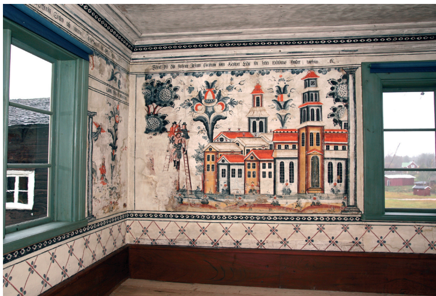
Image 7: Winter Carl Hansson's painting of the Descent from the Cross in the summer house of Danielsgården Farm in the village of Bingsjö. To the left is his rendition of Christ Praying in the Garden of Gethsemane. Both works are damaged. Stiftelsen Danielsgården, Rättvik.

ced in graphic art or in an illustrated broadsheet. 26 It is also possible that he saw it in illustrations distributed by the Pietists or Moravian missionaries who were active in the Swedish countryside during the time. Perhaps he was more influenced by such religious movements than has previously been assumed. 27 The poignancy and bodily presence in his version of the Descent from the Cross would point in that direction.