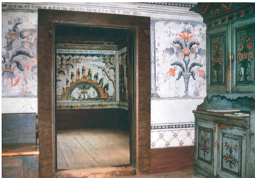
Image 1: A glimpse through the door into the kitchen of the summer house at Danielsgården Farm in Bingsjö. In the background we see one of Winter Carl Hansson's renditions of the Stages of Life. Stiftelsen Danielsgården, Rättvik. Photo: Sune Garmo.