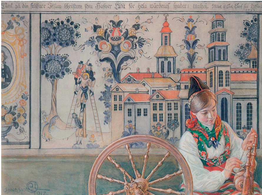
Image 8: In 1917, Carl Larsson completed The Spinner on a visit to Bingsjö. The painting was immediately sold to a buyer abroad and was not rediscovered until 2007. In the background we see Carl Larsson's copy of Winter Carl's Descent from the Cross showing the lower left corner before it was damaged.

As can be seen, the painting has been damaged. This damage must have occurred sometime after 1917. For decades it was impossible to know what the artist might have painted in the lower left corner. In 2007, however, a previously unknown watercolour by Carl Larsson surfaced at an auction sale. It shows a woman sitting at a spinning-wheel against the background of Winter Carl's Descent from the Cross (Image 8). It is one in a series of watercolours that Carl Larsson completed in 1917 during a visit to Bingsjö. Soon after painting it, he sold the work to a buyer from Austria, where it remained until 2007. 29 Carl Larsson's painting reveals that originally one additional person supported the central ladder on which Christ is being carried down. With this addition the composition is much firmer than in the damaged version. The Carl Larsson painting also indicates that Winter Carl included two female figures, presumably the two Marys.