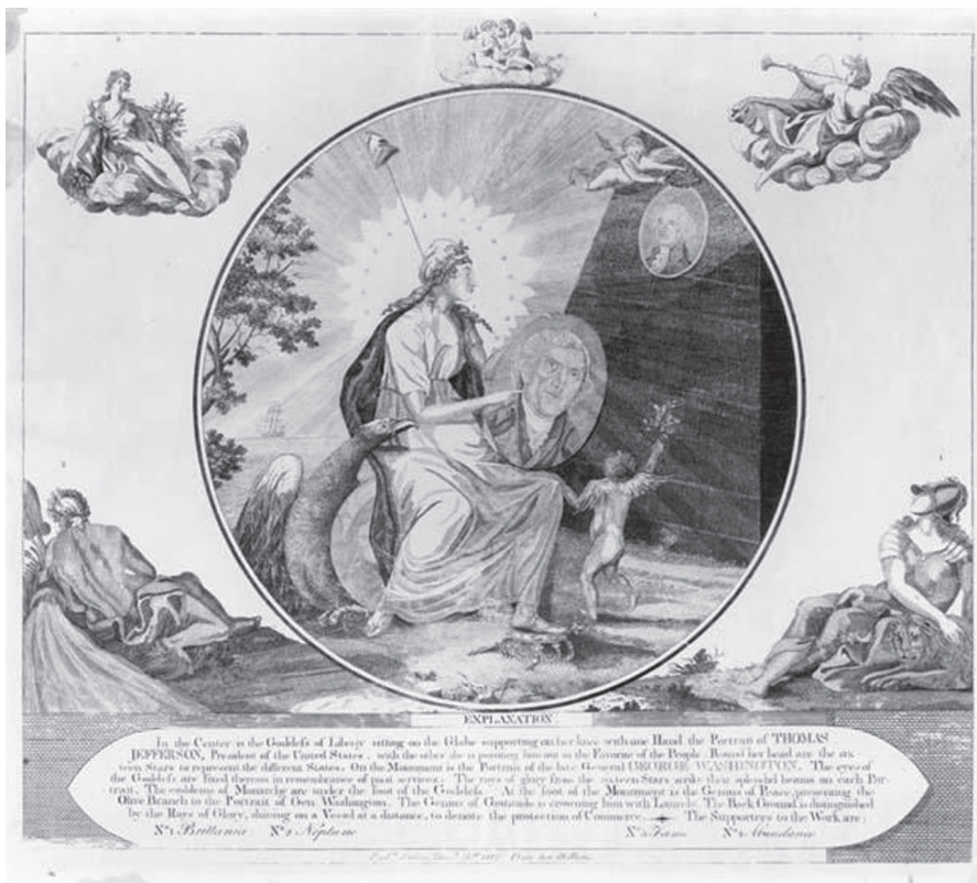
Image 3: Henry Dean, Untitled (1807). Etching and engraving with stippling sheet.

pians performed Columbia in her Temple on the theatrical stage on the very eve of the abolition legislation they did so with no mention of slavery or the ban on the slave trade. On 26 December 1807 the Chestnut Street Theater in Philadelphia staged a Christmas extravaganza titled The Spirit of Independence . The piece featured a large-scale backlit painting, or transparency, of Columbia in her Temple that served as the stage set. Although playbills for the Spirit of Independence did not name the painter, an untitled contemporaneous etching by the artist Henry Dean bears considerable similarity to the transparency (Image 3). In Dean's 1807 engraving, the Goddess of Liberty, adorned by her liberty cap and pole and holding a portrait of Thomas Jefferson, gazes admiringly at a portrait of George Washington.