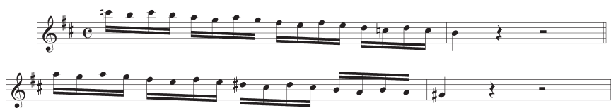
Exempel 7. Zaide , nr 9, Melologo ed Aria, takt 20–23 ( violino primo ).