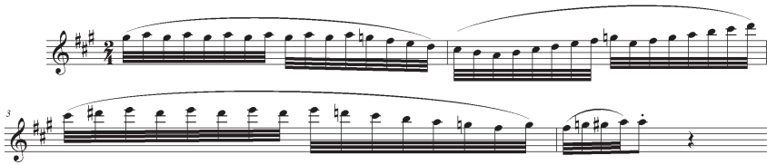
Exempel 1. Die Entführung aus dem Serail , nr 4, takt 40–43 (flauto).

men han utökar och förändrar denna genom att skapa mening baserad på det musikaliska systemets struktur och syntax. Av figurerna är suckandet, sospiratio , en traditionell och mycket använd retorisk figur. Den förekommer i många olika skepnader, men gemensamt för alla är förhållningar följda av paus. I scenen ovan skildrar den Belmontes bävan inför det länge efterlängtade mötet med Constanze. Mozart väljer att ytterligare förstärka den känslomässiga situationen genom att addera hjärtklappning, crescendo, för att visa hur Belmontes upphetsning ökar och en figur i violinen som tillsammans med flöjtens ”susande” får Belmonte att tänka på Constanzes läspande: 10