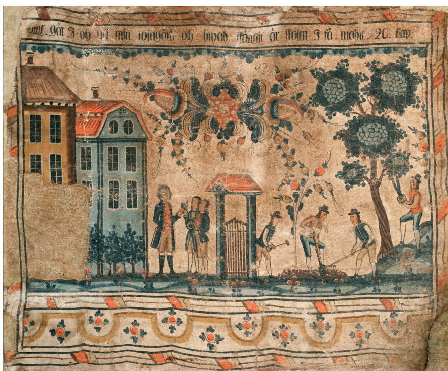
Image 4: This painting of the Workers in the Vineyard by Winter Carl Hansson was found in 2007 during a kitchen renovation in Insjön.

The Dalecarlian artists had never seen a vineyard and could hardly envision what one looked like. Nor could they learn much from the indistinct images