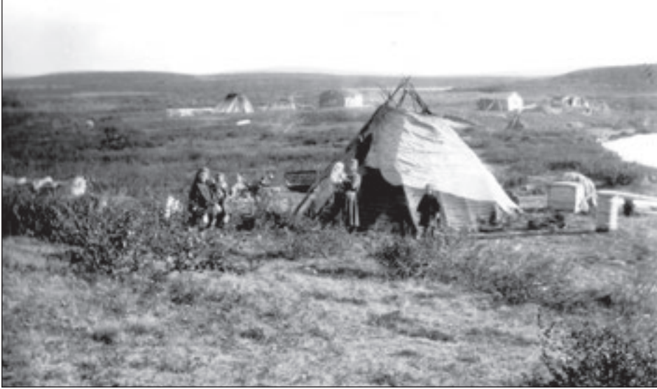
Govva 2. Goadástallan geasseguohtoneatnamiin Bievrrašjávrris 1900-logu álggus.

váldokultuvrra árbevirolaš sohkaallevuogádaga, mas eamidis lei ruovt-tubarggu ovddasvástádus ja isit dinii ruđa barggus. Rievdadus ii lean goitge ná alvvus sámiid sohkaeallerollain go váldokultuvrra vuogádagain. Sámi nissonolbmuid boazobarggut báhce unnibun dálvet, muhto geasseguohtoneatnamiin ja boazobarggu jahkodatdáhpusain maiddái nissonolbmot ledje boazobarggus mielde seamma ládje go ovdal dáluide muotkuma. Jos herggiid válde šilljui dápma vástede dehe eará dihte, de daid sirdin lei eamida ja mánáid bargu. Nissonolbmot maid duddjoje bearraša bivuid dego goahteáiggenai. Ovdal go mohtorfievrrut márre boazoealáhusa sisa dáluide muotkuma mañjel, de bearraša isit sáhtii šaddat leat boazobargguid dihte guhká eret bearraša luhtte, daningo meahccái šattai čuoigat ja guhkes gaskkaid dihte doppe maid šadde idjadit oba mihá dávjá.