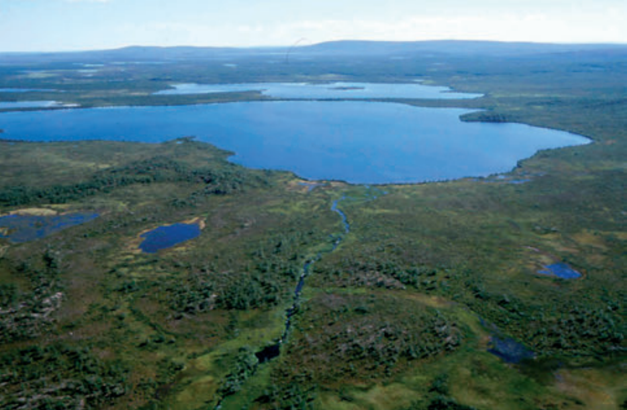
Govva 1. Jávrrešduottarlaš kulturduovdda. jagi 2000.

duottarguovllu kárta). Guovllu buot boazodoallit leat sápmelaččat. 1960-logu loahpageahčái buot siiddaid váldobargogiellan lei davvisámegiella ja das maŋnel Näkkela siidda bargogiellan molsahuvai suomagiella go fas Njunnása ja Vuottesjávrra siiddain davvisámegiella seailui váldobargogiellan. Guovllu boazosápmelaččat hupmet davvisámegiela oarjesuopmana, mii spiehkkaš unnánaš Guovdageainnu váldosuopmanis. Jagi 1960 rádjái suomelaččaid boazodoallu lei oba unni Näkkela bálgesa viidodagas.