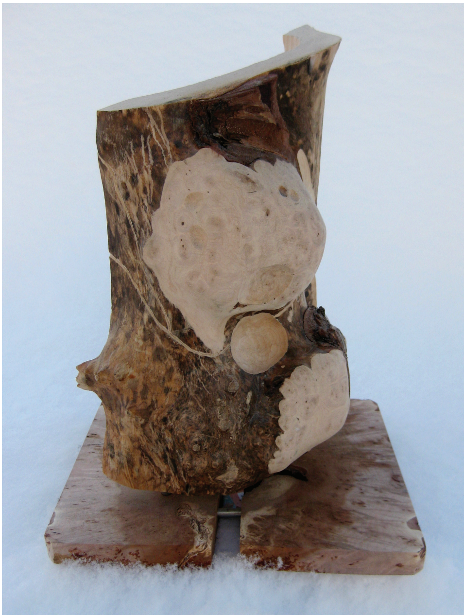
Govva. Jumežat (bácci duojár: Gunvor Guttorm). Govven: Gunvor Guttorm.