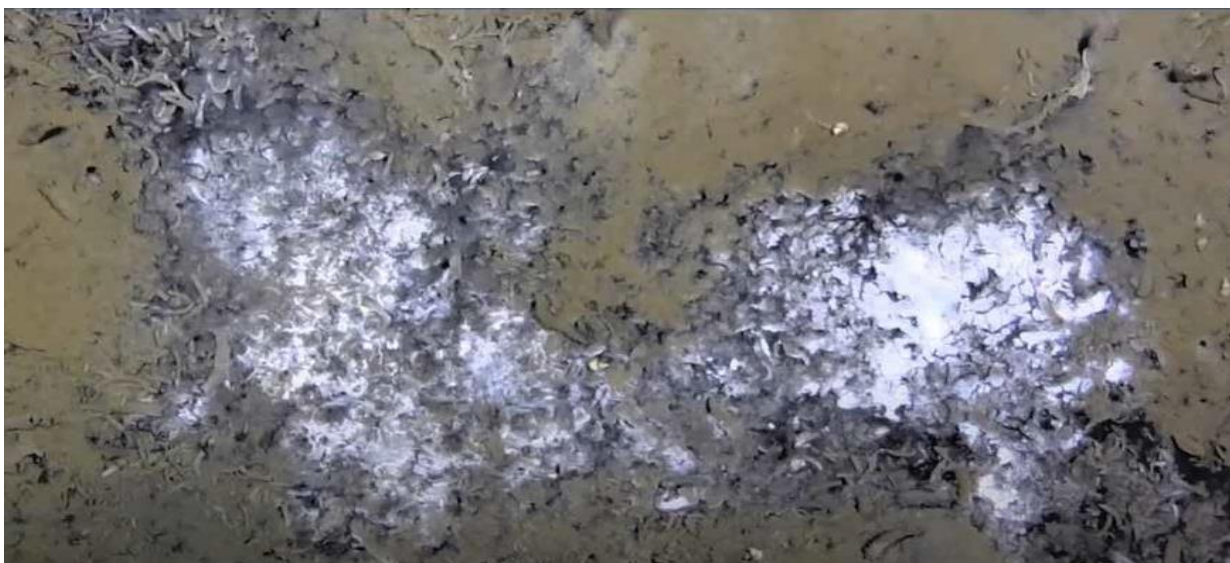
Приклад бактеріальних килимів, знайдених на дні в Арктичному океані.

Так само як відходи продуктів, з якими ми звикли мати справу на землі, сірководень ( H_2S ) пахне каналізацією та гнилою органічною речовиною. Він смердючий, але цей запах означає, що життя підтримується! Хоча сірководень отруйний для багатьох істот, бактерії можуть здійснювати хемосинтез та жити у місцях, де він накопичується. Бактерії, зазвичай білуватого або голубуватого відтінку, можуть об'єднуватися й утворювати так звані «бактеріальні килими» на дні моря.