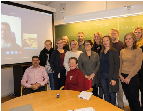
Guwie: SSHF, UiT