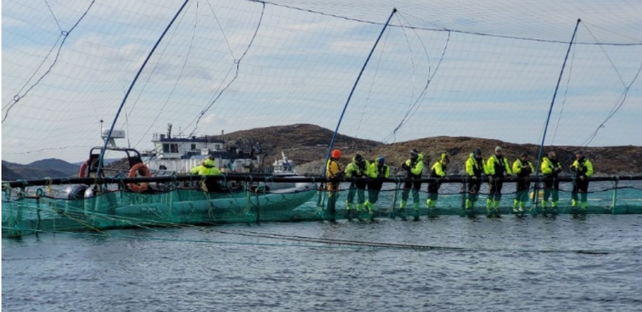
Undervisning om akvakultur i Flatanger i 2023.