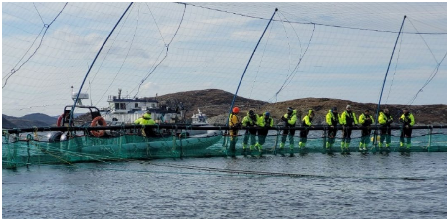
Undervisning om akvakultur i Flatanger i 2023.