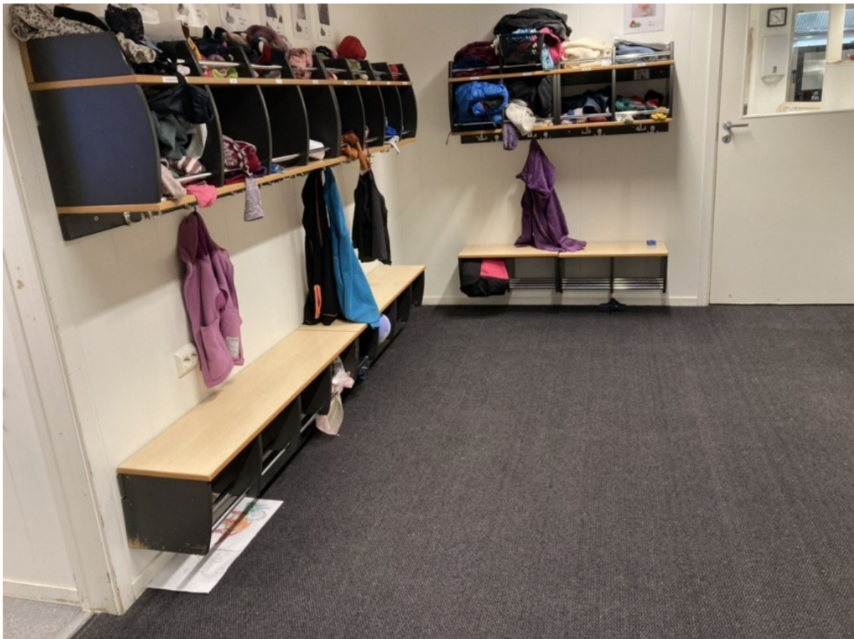
Figur 2: Garderobehyller og benker, dører mot avdeling (venstre) og kjøkkenet (høyre).

Avdelingene i barnehagen har hver sin inngang med yttergang og garderobe. Yttergangen brukes til å kle av og på sko og ytterklær. Her er kroker til ytterklærne, skohyller, et tørkeskap og noe utstyr til uteaktiviteter. I garderoben står det benker med garderobehyller over langs tre av veggene (figur 1 og 2). Hvert barn i avdelinga har sin egen plass med navn og bilde og fornavnene til foreldrene. Her blir det tydelig at også barnehagens ansatte opptrer som planleggere av rommets representasjoner . I det ene hjørnet har de satt opp ei hylle med sangkort, som brukes under samlingsstund, samt matbokser og drikkeflasker. Ved døra mot avdelinga er det en magnetavle med skiftende oppslag. I samme hjørne er det satt fram leker (figur 3). Ofte er det kasser med duploklosser, men i perioder var disse byttet ut med byggeklosser eller et dukkehus. Personalet har også hengt opp plakater med bilder og litt tekst om aktiviteter og utflukter barna har vært med på.