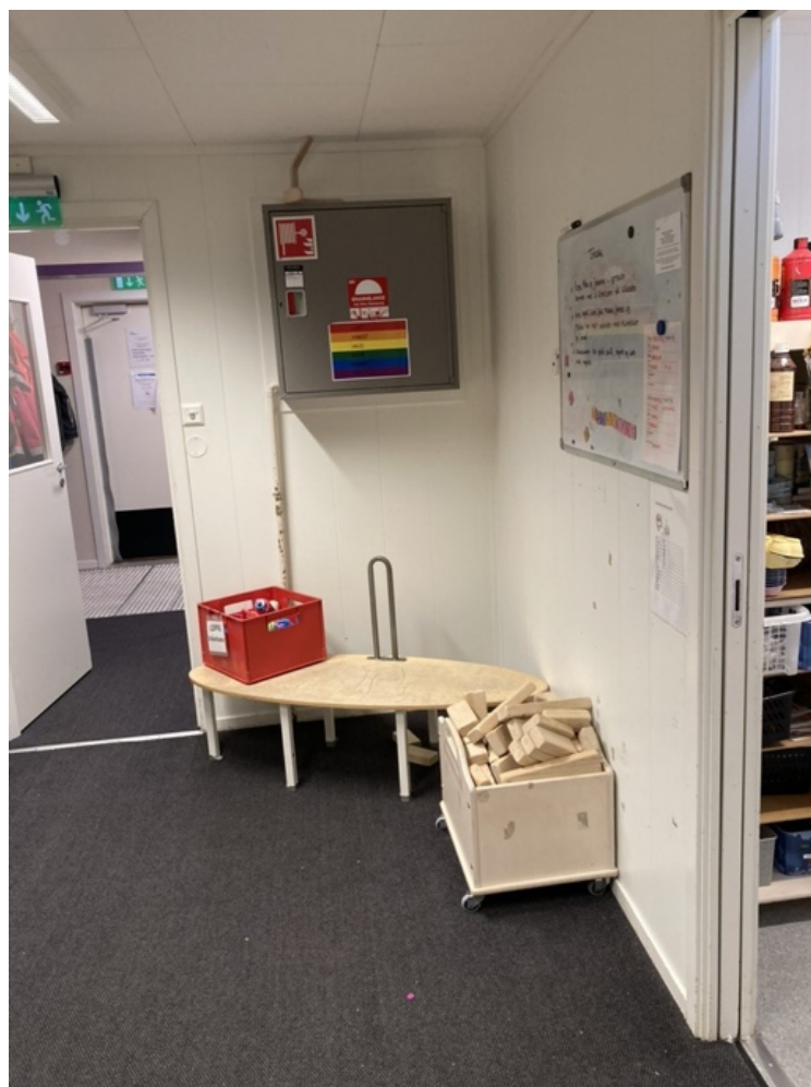
Figur 3: Hjørne med påkledningstrapp, leker og magnettavle, dører mot yttergangen (venstre) og avdeling (høyre).

Mange av våre observasjoner vitner om en romlig praksis , som har etablert seg i samspill mellom rommets ulike brukere. Noen av disse praksisene forutsetter rommets utforming og innebygde maktforhold, andre videreutvikler eller utfordrer dem (jf. Androutsopoulos & Kuhlee, 2021, s. 7). Påkledningstrappa på golvet er et godt eksempel på dette. Den skal sikre en mer ergonomisk kroppsholdning for personalet når de hjelper barna med påkledning. Under våre besøk var denne lite i bruk til sitt egentlige formål. Derimot ble påkledningstrappa og garderobebenkene brukt mye av barna til å hoppe ned fra.