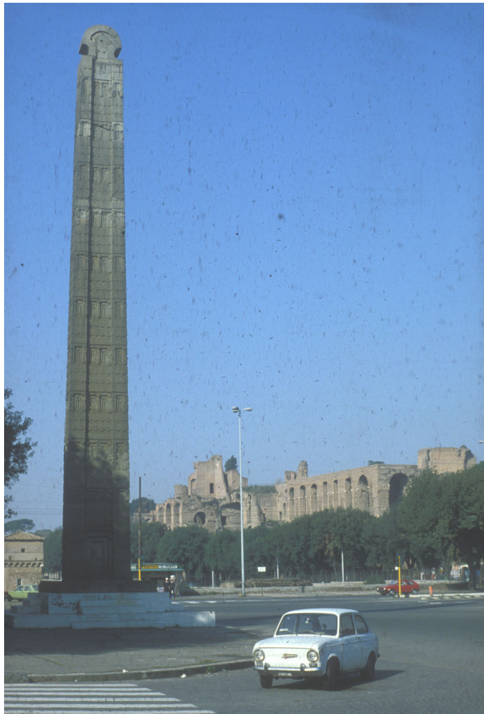
Aksumstelen på Piazza di Porta Capena i Roma.

Aksumstelen inngår også i en annen, men nært beslektet sammenheng. Piazza di Porta Capena ligger like ved den antikke vedde- løpsbanen, Circus Maximus, og Aksumstelen var plassert slik at den sto på forlengelsen av dens midtakse. Den 9. mai 1936, fire dager etter at Addis Abeba var blitt inntatt, erklærte Mussolini i en tale fra balkongen på Palazzo Venezia at nå var det romerske imperiet gjenoppstått etter femtenhundreår. 12 Mussolinis og det fascistiske