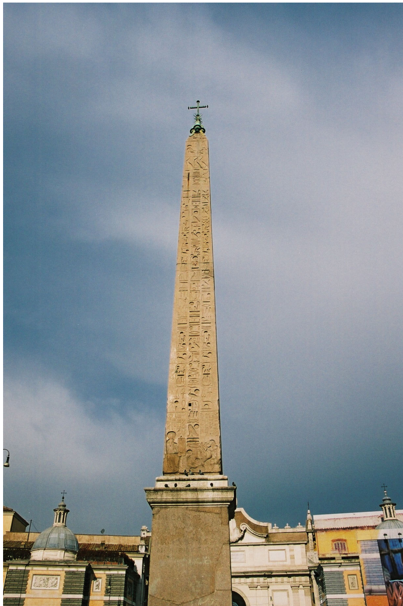
Obeliskens som én gang sto på Circus Maximus og nå står på Piazza del Popolo.

inkluderte Ara Pacis og Mausoleum. Det var anlagt slik at på Augustus' fødselsdag, som falt sammen med høstjevndøgn, nådde skyggen fra obeliskens frem til inngangen på Ara Pacis. Solgudens makt ble dermed direkte knyttet til Augustus' liv og skjebne.