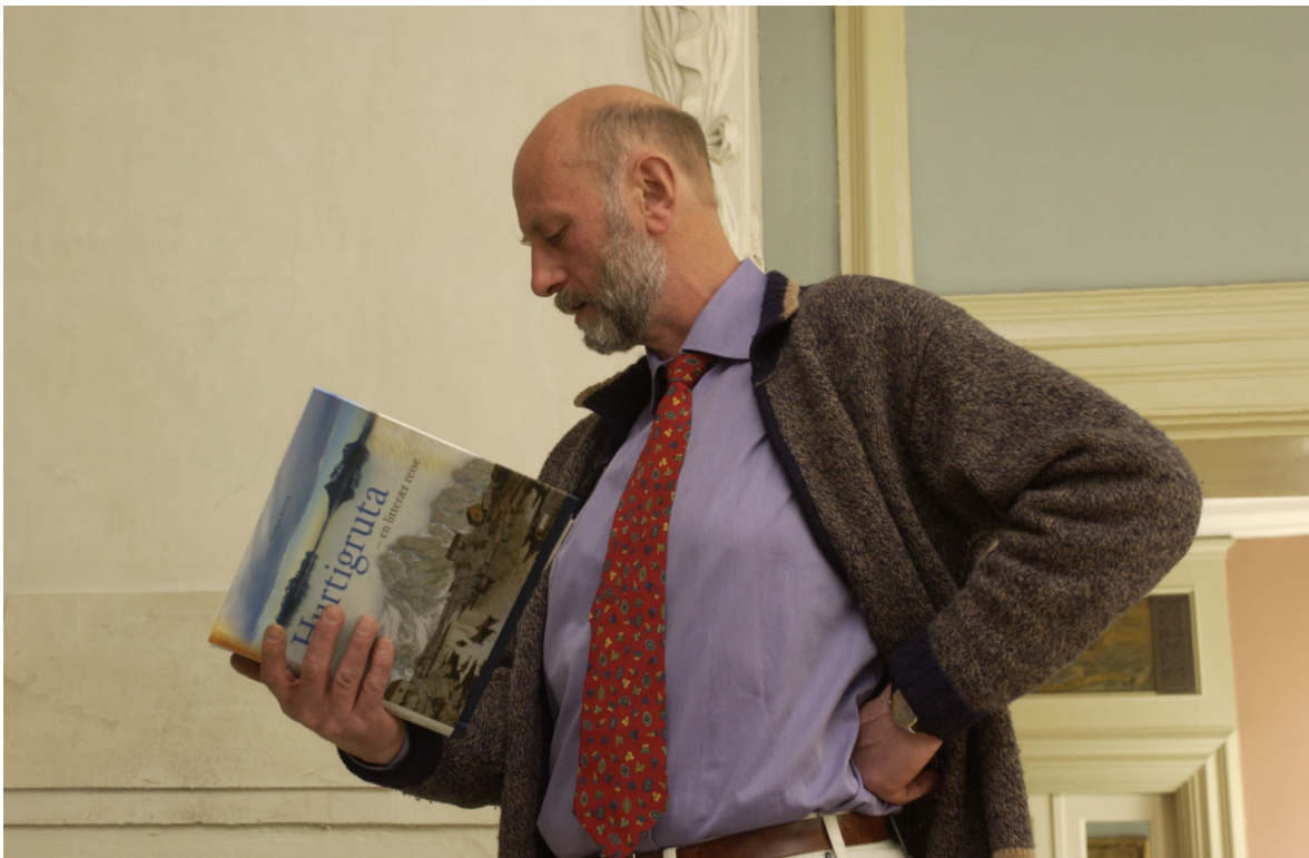
April 2002. Ved lanseringen av Hurtigrute-boka