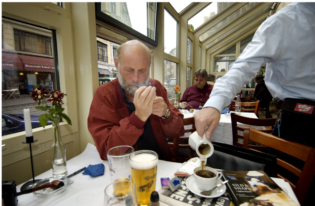
Juni 2003. På Harlekin restaurant i Bogstadveien.

Øysteins store arbeidsdisiplin var kombinert med en like stor evne til sorgløst å nyte øyeblikket, ikke minst i sammenheng med mat og drikke. Å sette seg til bords med Øystein var å gi seg hen til noen lykkelige timer med både latter og litteratur, sang og taler, fisk og filosofi. Han var sine venners venn, men han var like raus og hjertelig mot vilt fremmede og kunne med imponerende sakkunnskap og engasjement delta i samtaler, ikke bare om hans to store lidenskaper, litteratur og fisk, men om allverdens andre emner - spydkast og skøyteløp, tango og poker, rock og jazz, kvinnesak og kokebøker, filetskjæring og film noir, travløp og tipping. Øystein var virkelig det våre forfedre kalte en "gleðimaðr mikill", en mann som omga seg med et stort, luftig rom av vennlig generøsitet, og i dette rommet var det plass til alt og alle.