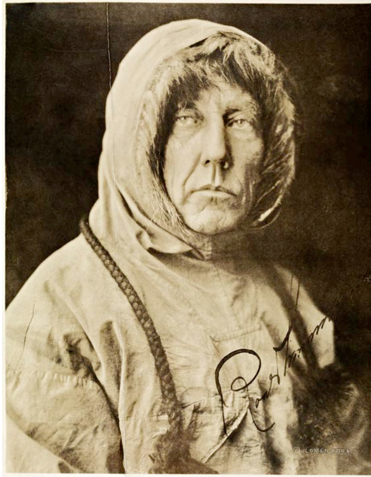
Hetteportrett. Roald Amundsen, Nome, Alaska ca 1920.