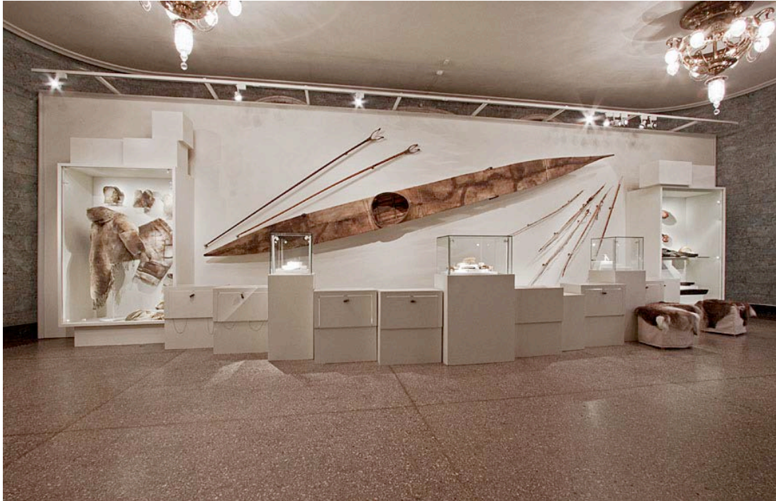
Arktiske eksperter.

Utstillingene SNOWHOW og Arktiske Eksperter utfyller hverandre på flere måter. Mens SNOWHOW formidler ut fra polarheltenes ståsted, søker Arktiske eksperter -utstillingen å formidle ut fra urbefolkningens ståsted. Ved fremvisningen av Netsilik-inuittenes gjenstander får deres kunnskap om livet i Arktis fremtre, mens Amundsen fremstilles mer som en leverandør av gjenstandene til museets samlinger. Fremstillingen i utstillingen kunne imidlertid hatt en tydeligere link og forklart mer eksplisitt hvordan disse arktiske ekspertene fikk betydning for norske polarekspedisjoner. Ved å fremheve hvordan Amundsen tok i bruk disse erfaringene og kunnskapene, ville fremvisningen av gjenstandene fått frem inuittene betydning og funksjon som de virkelige arktiske eksperter i den norske polarhistorien.