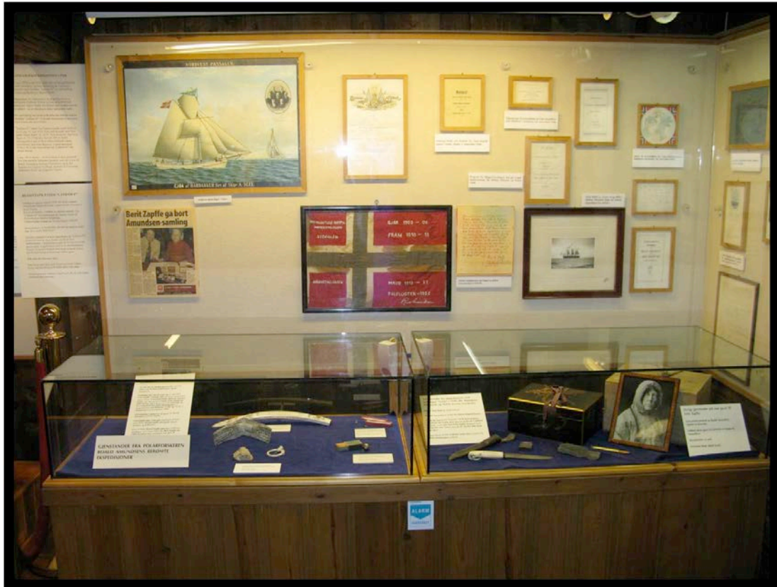
Monter med gjenstander fra Roald Amundsens ekspedisjoner.