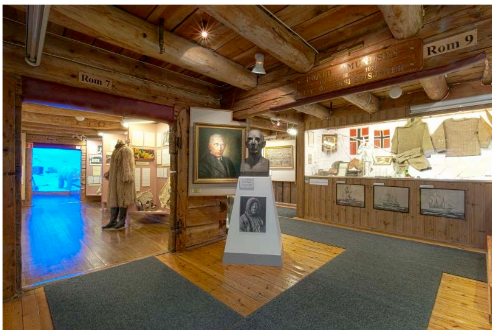
Fra utstillingen på Polarmuseet.

Utstillingen om Roald Amundsen har en sentral plass på Polarmuset og tar opp omtrent ¼ av arealet. Her blir hans biografi og polare liv fortalt gjennom tekst, foto og gjenstander. Montrene med omfattende og unike gjenstander understreker en materiell fremstillingsform.