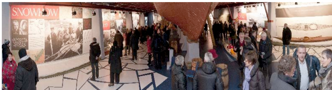
Fra åpningen av utstillingen "SNOWHOW. Polarheltenes læremestre: inuitter, samer og ishavsfolk".