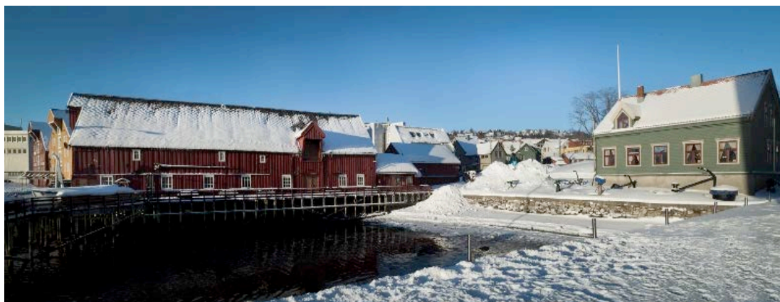
Polarmuseet. Den røde Tollboden er i dag museets utstillingslokaler. Det gamle Tollkontoret holdt til i den grønne bygningen og er nå museets kontorlokaler.

En av museenes mange roller er å produsere forestillinger og fortellinger om historiske sammenhenger, der tekstlige, visuelle og materielle virkemidler fremstiller historien. Hvilke fortellinger, perspektiv og representasjoner er det som formidles i polarhistorien og om polare helter? Bidrar fortellingene til å individualisere og personliggjøre gjennom fokus på polare helter i historien? Eller er fortellingene bygd opp slik at de åpner for refleksjon og nye perspektiver hos besøkende? I Tromsø er det særlig Polarmuseet som har rollen som museal formidler av norsk og lokal polarhistorie. Jeg vil ta utgangspunkt i dette museets utstilling om Roald Amundsen og undersøke hvordan noen av de nye utstillingene fra 2011 formidler polarhistorien knyttet til Amundsen. Hvilke fortellinger presenteres for publikum i utstillingene? Er det rom for nye perspektiver og nye heltebilder?