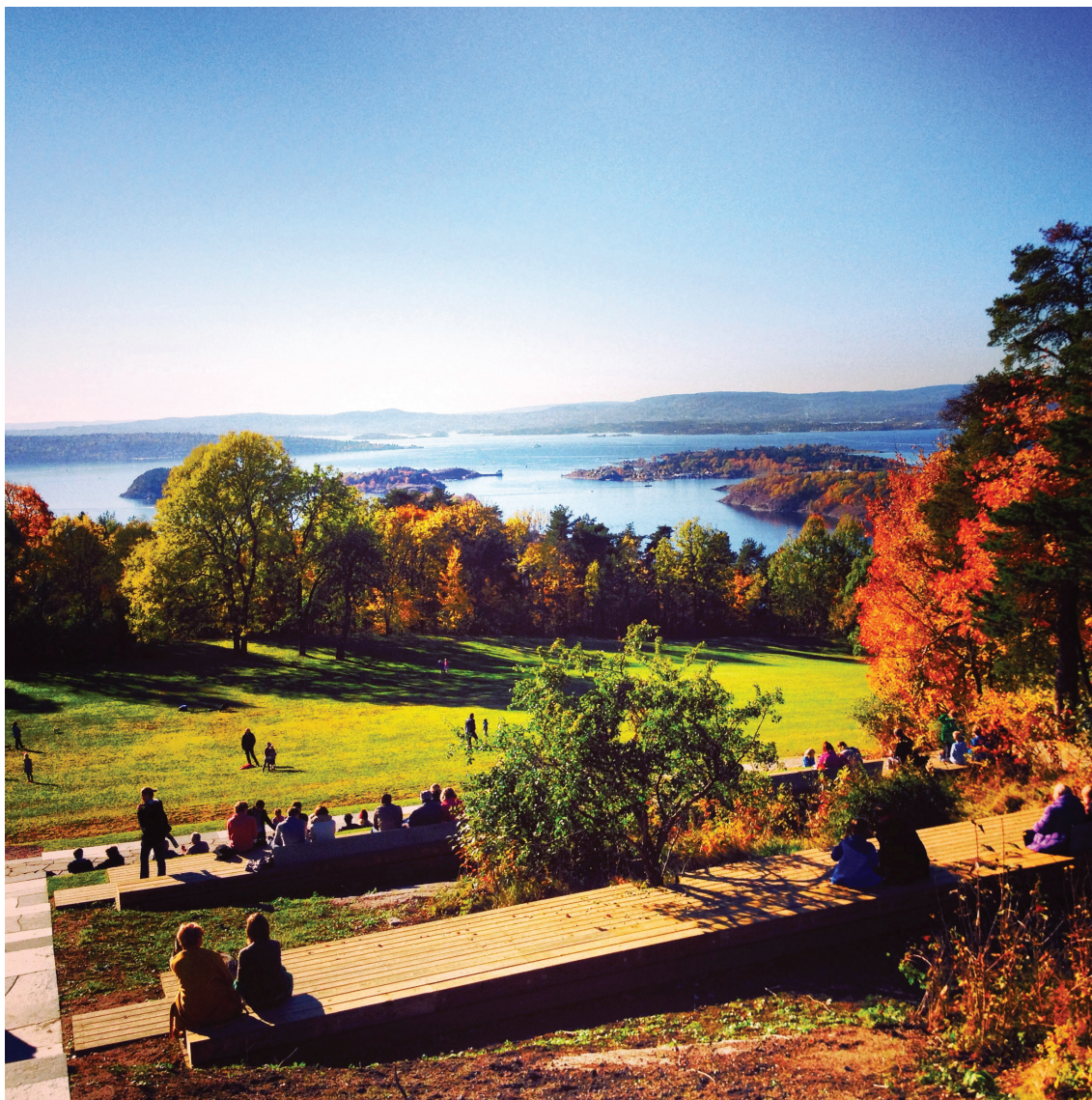
Ill. 1. Ekebergparken byr på en storslagen utsikt over Oslofjorden. Her er det omstridte trappeanlegget sett ovenfra. Hovedtrekkene til det gamle anlegget er gjenskapt i nye materialer, og supplert med solide benker mellom de to trappeløpene.