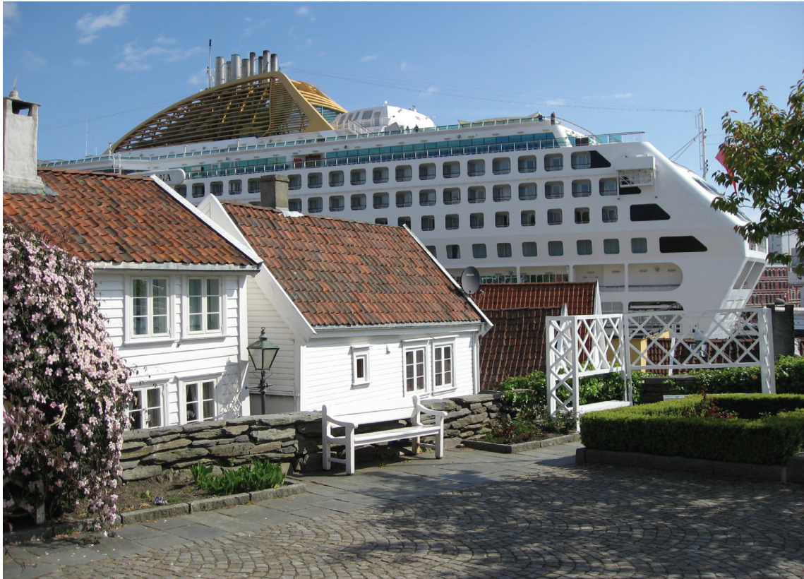
III. 5. Gamle Stavanger er en betydelig turistattraksjon på grunn av bydelens unike karakter med en tett struktur, en tilnærmet autentiske bygningsmassen og lokaliseringen ved havnen. Mange turister oppfatter området som et museum.

Uthus og gjerder ble langt på vei rensket bort. De ble ansett som skjemmende og lite anvendbare. Behovet for å gjøre området "pent", var trolig langt større enn hva vi i dag kan forestille oss. I dag er denne penheten noe av det som oppleves som problematisk ved området. Enkelte vil oppleve det som nostalgisk, gentrifisert, "museifisert" og over-