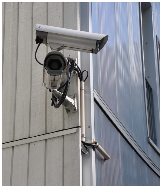
Ill. 14. Småbyens sosiale kontroll er avløst av diskret plasserte overvåkningskameraer. Dette er montert ved bevaringsområdet i Stavanger sentrum.

Den første vernebølgen like etter annen verdenskrig kom som en reaksjon på de omfattende saneringsplanene og forfallet som fulgte i kjølvannet av disse. Bevaring dreide seg om å ta vare på noe av det gamle for ettertiden, som et minne om en tid som ugjenkallelig var forbi. Ved å rydde opp i de gamle og forfalne bygningsmiljøene, rense bort det stygge og uhensiktsmessige, og reparere og pleie det gamle på en ærbødig måte, ville man skape gode boliger og gode opplevelser. Kulturminnevern var fortsatt et smalt felt – styrt ovenfra og ned - men både antikvarer og arkitekter tilhørte de gruppene som involverte seg i dette arbeidet, og innsatsen var preget like mye av sosial samvittighet som av vilje til form.