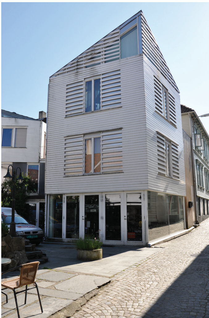
Ill. 12. Nybygg som er satt inn i det eksisterende bevaringsområdet i Stavanger sentrum der kontrast er et prinsipp. Skalaen og forholdet til omgivelsene er videreført, materialbruk og materialdimensjoner gjenkjennbare, men takformen, måten å bruke treverket på og overgangen mellom bygning og terreng bryter med tradisjonen.

I dag synes ikke lenger frykten for fragmentering og tap av helhet – som kjennetegnet bevaringen av Gamle Stavanger – lenger å være til stede. Det som er annerledes og fremmed