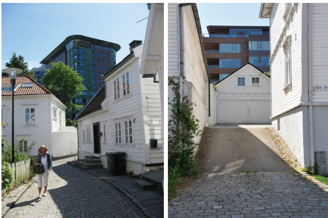
III. 4. Gamlebyen i Stavanger er innrattet av moderne bebyggelse.

Som prosjekt betraktet fremstår Gamle Stavanger utvilsomt som vellykket. Men for hvem er området ”vellykket”? Her vil oppfatningene være delte, og de varierer også over tid. Synet på hva som er god bevaring endrer seg, på samme måte som synet på hva som er god arkitektur.