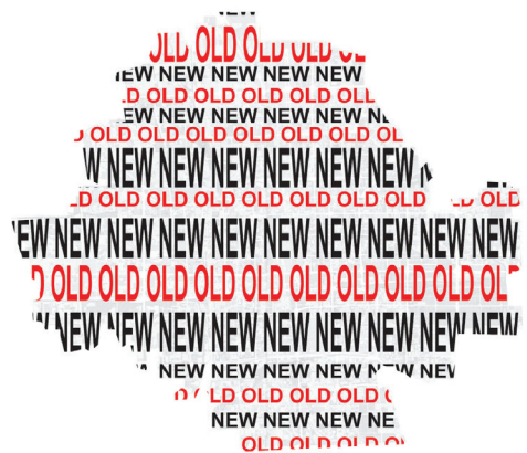
Ill. 1. Illustrasjonen viser Rem Koolhaas' ideskisse til prinsipp for bevaring/fornyning i Beijing. Ved å legge en "barcode" over bykartet defineres striper av byområder som enten saneres til fordel for noe nytt, eller bevares som de er i dag. På det viset slipper man å ta stilling til hvilke konkrete objekter som skal bevares for ettertiden. Man leverer en viss mengde, og neste generasjon kan gjøre sine valg innenfor det som er overlevd. Norske bevaringsområder har blitt til gjennom langt mer komplekse prosesser.

Et enkelt kartutsnitt, påtegnet reguleringsgrense og fargelagt for hånd (ill. 2) viser den opprinnelige reguleringsplanen for et område som i dag framstår som et av våre mest