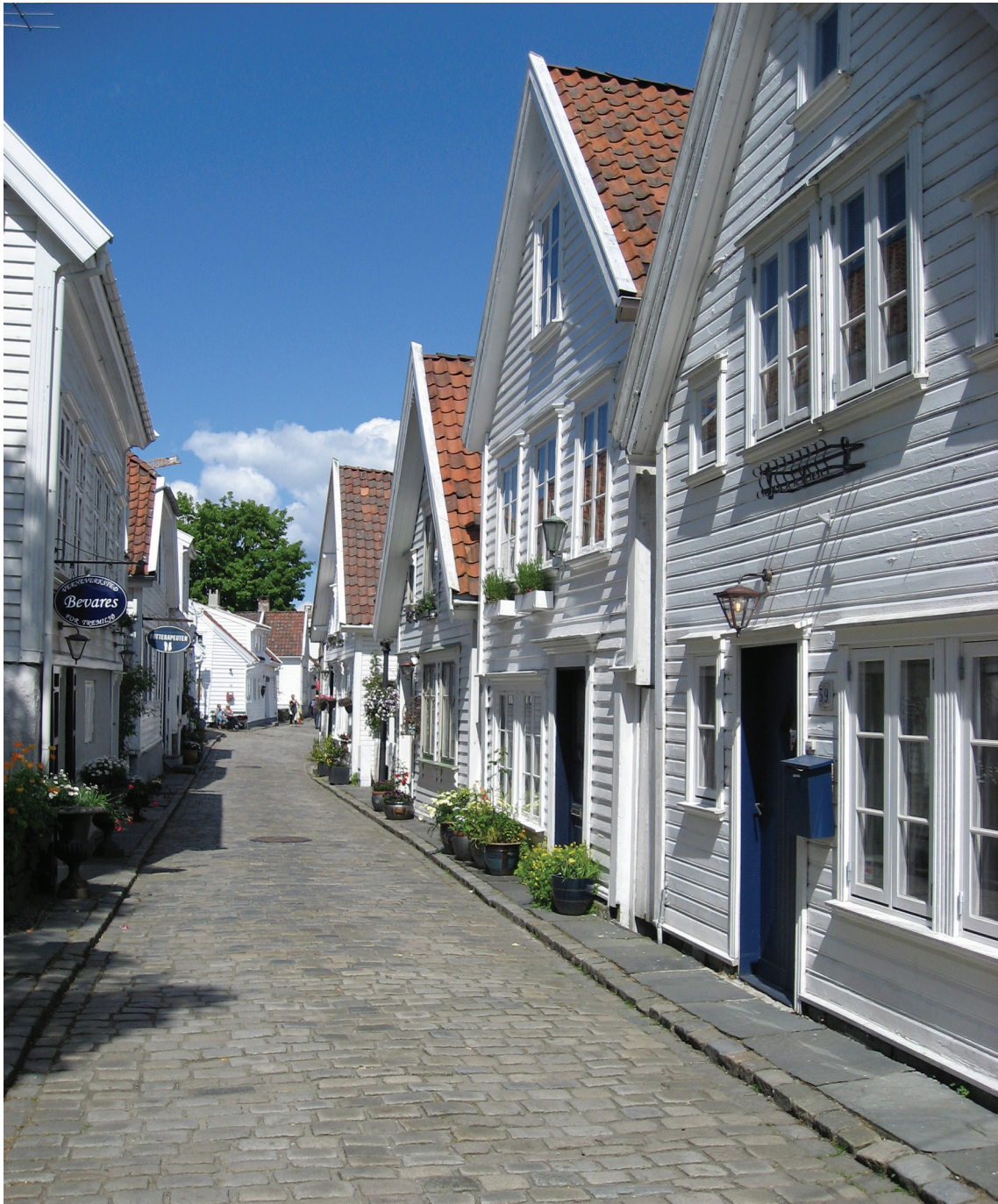
III. 3. Øvre Strandgate i Stavanger. Foto: Johanne Sognnæs 2008.