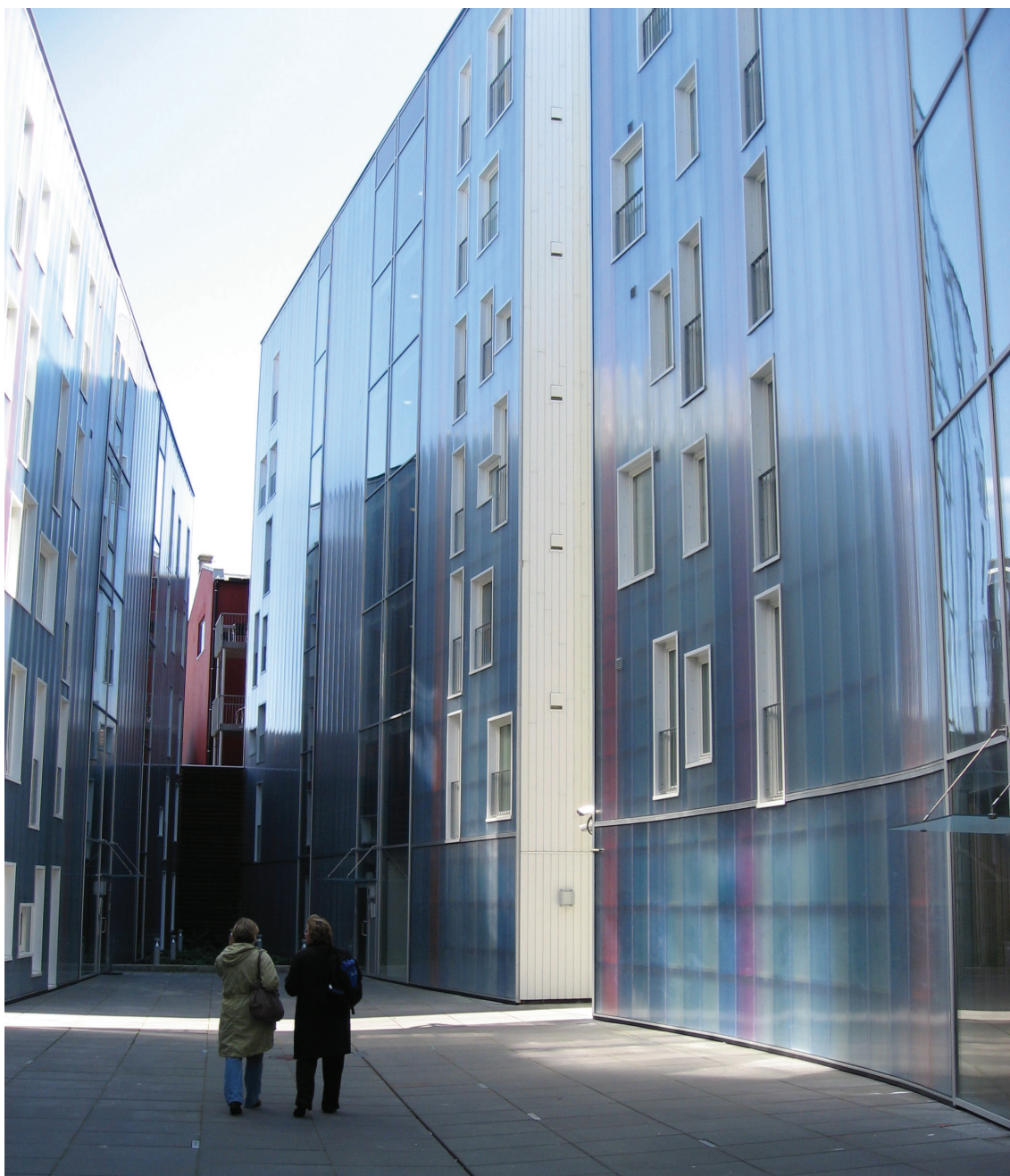
Ill. 13. I den nye bygningen i bevaringsområdet i Stavanger sentrum brytes det både med skala, form, materialbruk og bearbeiding av uterommet. Prosjektet er omdiskutert, og politikere og administrasjon har i ettertid uttalt at man her har tøyd bevaringsplanen for langt i frykt for at området ellers ville ha blitt liggende brakk. Foto: Johanne Sognæs 2008.