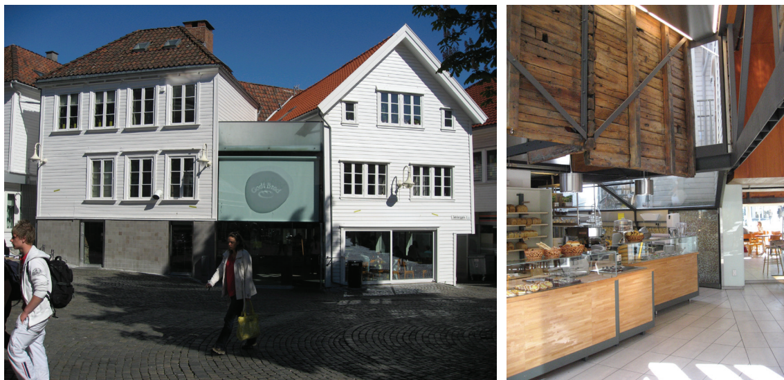
Ill. 11. Bruk av kontraster i bevaringsområdet i Stavanger sentrum – utvendig diskret, innvendig offensivt og utprøvende. Om man ikke oppfatter skillet mellom nytt og gammelt utvendig, kan det ikke reises tvil når man kommer inn. Foto: Johanne Sognnæs 2008.