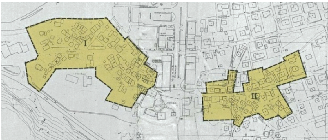
III. 8. Bevaringsområdet på Lærdalsøyri med opprinnelig avgrensning fra 1970. Illustrasjonen er hentet fra Gamle Lærdalsøyri. Plan for vern, vedlikehold og forvaltning, utgitt av Lærdal kommune i 2005.

Hvorfor var man så tidlig ute i denne lille kommunen, som bare har et par tusen innbyggere? Stedet, som var nær ved å få bystatus i 1842, sto nærmest stille etter denne tid. I nabo-kommunen Årdal, som lå innerst ved neste fjordarm, var situasjonen radikalt annerledes.