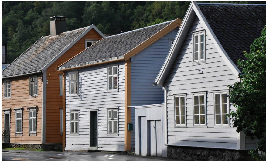
Ill. 9. Fra bevarings- området på Lærdals- øyri. Foto: Johanne Sognnæs 2008.