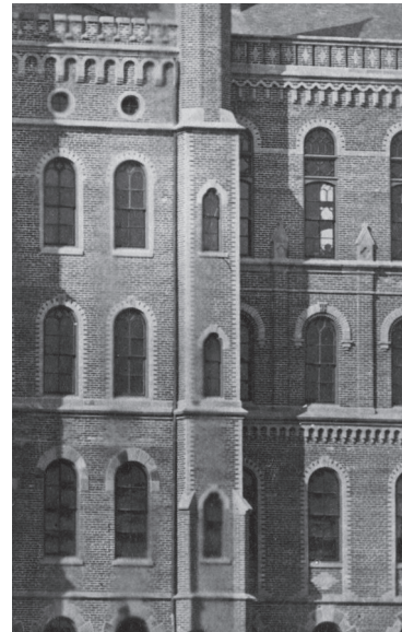
Ill. 3. Old Main. Lys kantmuring utført i lokal sandstein. I vinduet til kirkesalen øverst til høyre anes en rikere utforming av vindussprossene. Utsnitt av foto fra ca. 1865, Luther College Archives.

Old Main fikk en plassering som tydelig var valgt for at bygningen skulle synes fra alle kanter og i vid omkrets. På den store eiendommen på høyden vest for byen ble bygningen plassert tronende på pynten over en skrent der elven Upper Iowa River renner fredelig nedenfor. Der lå