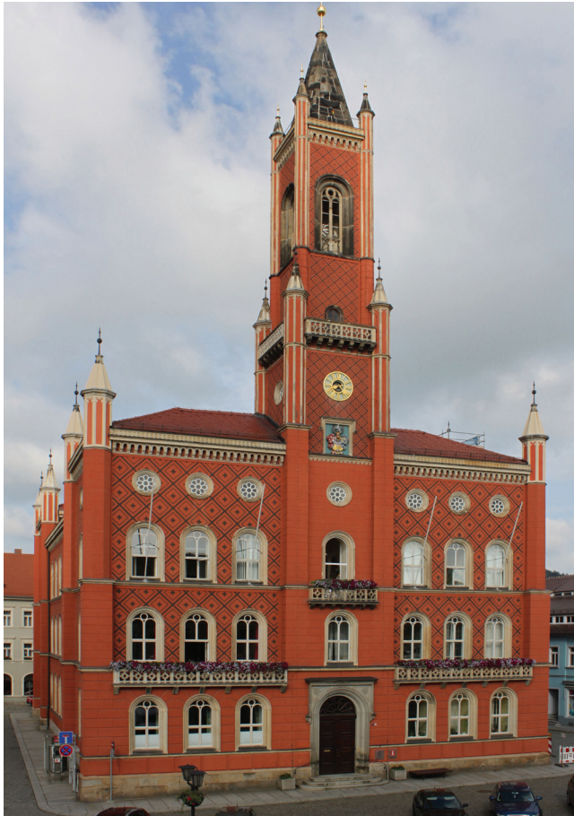
Ill. 6. Rådhuset i Kamenz, Sachsen 1846–1848, arkitekt C. A. Schramm. Foto: J. Chr. Eldal 2012.

fra forskjellige forbilder. Bare sjelden ble hele bygninger hentet ut fra denne litteraturen. Også kirkesamfunn som byggherrer var det vanlige i Ohio. Man arbeidet ikke bare for høyere utdanning, men for å opprettholde samfunnets religiøse karakter og sitt eget kirkesamfunns egenart. 32