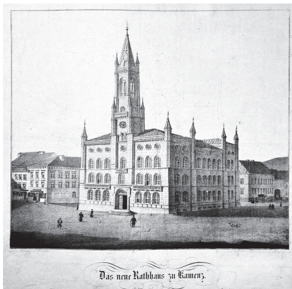
Ill. 7. Rådhuset i Kamenz, litografi ca. 1850.