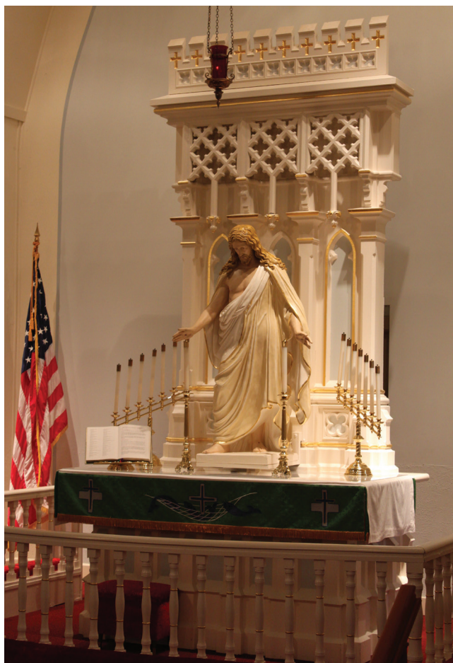
Ill. 8. Altertavle i Stavanger kirke, Iowa, laget for Calmar kirke 1868 og flyttet hit i 1887. Trolig tegnet av C. H. Griese. Kopien av Thorvaldsens Kristusfigur hørte opprinnelig ikke med.

Alle tre kirkene var trolig tegnet i 1869 da byggearbeidene startet i Washington Prairie og Stavanger, mens byggingen i Glenwood startet året etter. Det drøydde litt både med bygging og finansiering så det tok 4–5 år før de to første ble innviet i desember 1873 og Glenwood som den siste i november 1874. Både på Washington Prairie og i Glenwood hadde man allerede i 1865 vedtatt at presten skulle skaffe tegninger og kostnadsoverslag, og det var lenge planer om bygging i teglstein. I 1867 vedtok alle menighetene også å overta en stor del av gjelden etter bygg-