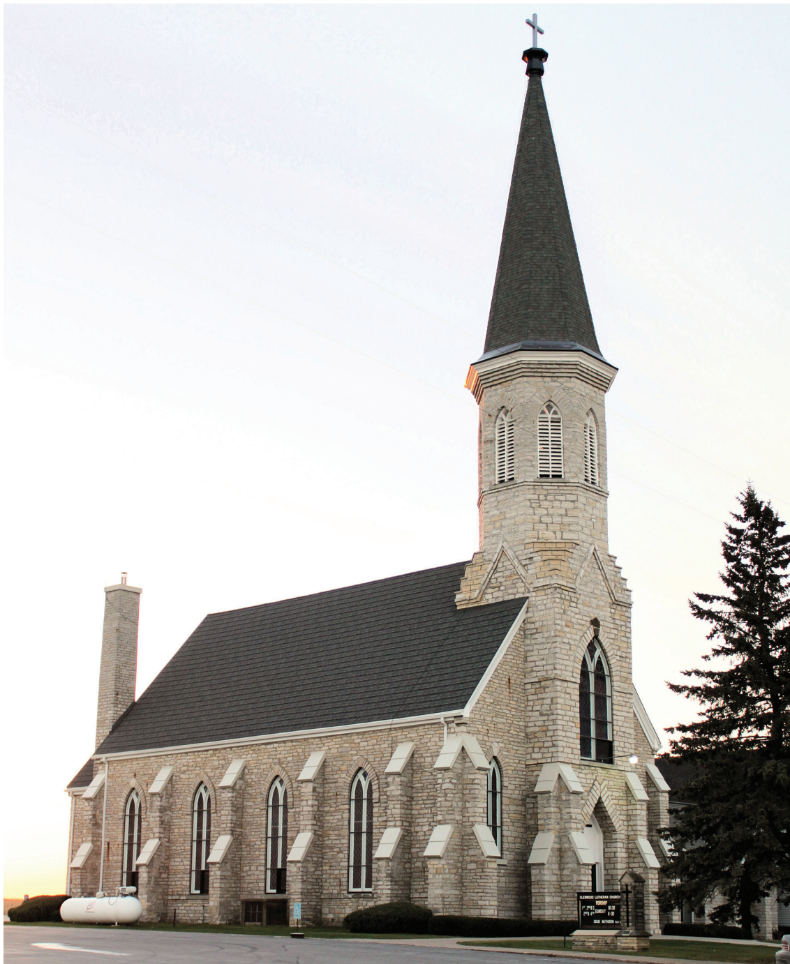
III. 10. Glenwood kirke, Iowa, 1870–1874, arkitekt C. H. Griese. Tårnets klokkeetasje oppført 1892.