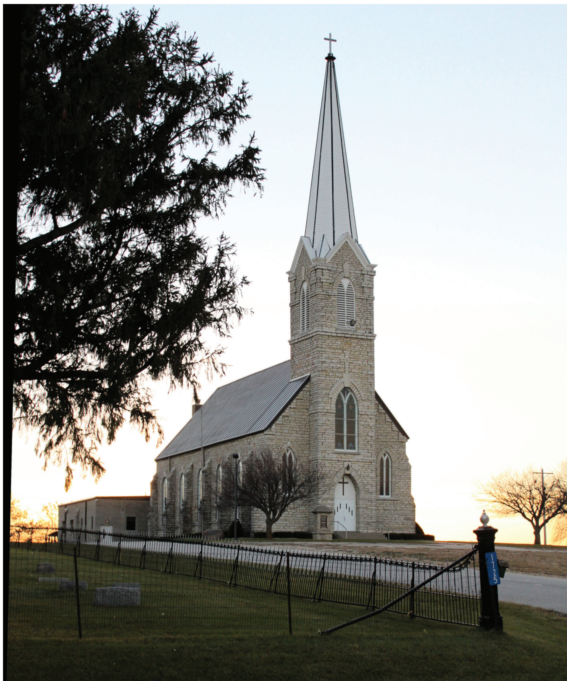
III. 9. Washington Prairie kirke, Iowa 1869–1873, arkitekt C. H. Griese.