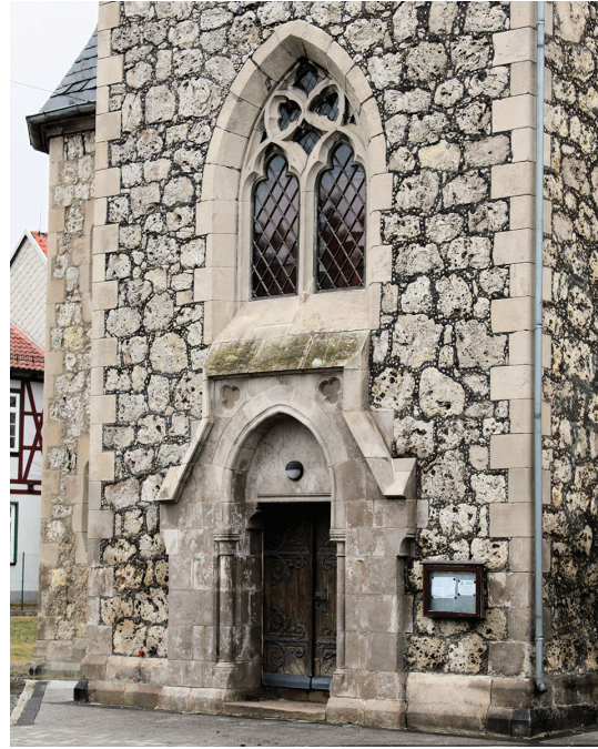
Til venstre: Ill. 18. Landsbykirken i Niedersachswerfen, Thüringen, 1869, arkitekt Conrad Wilhelm Hase. Til høyre: Ill. 19. Niedersachswerfen, Thüringen, hovedinngang i tårnfoten.