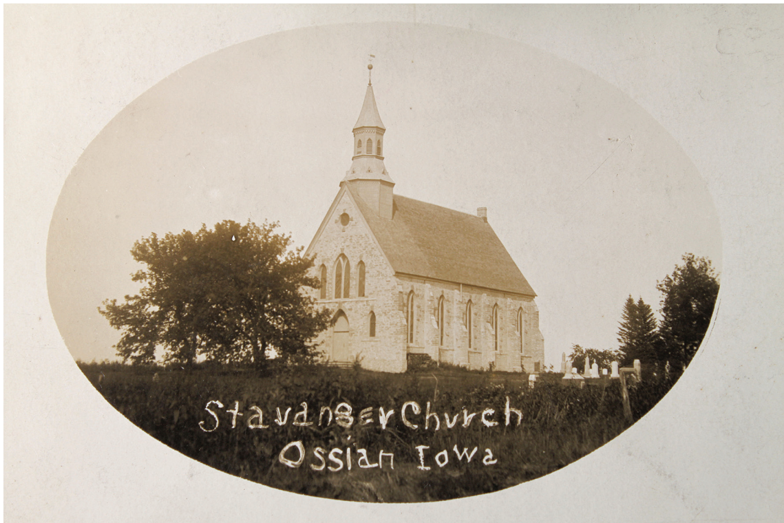
Ill. 11. Stavanger kirke, Iowa, arkitekt C. H. Griese 1869–1873. Foto: ca. 1918, før fasadenes kalksteinsmurer ble innkledd.

ingen av Luther College, så det var store løft for dem med kirkelige byggearbeider i denne perioden. 40 Og alt dette skulle finansieres med innsamlinger i menigheten.