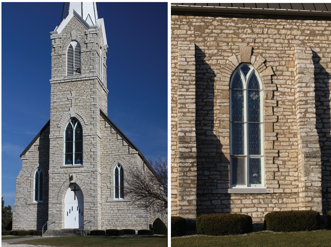
Til venstre: Ill. 16. Washington Prairie kirke. Foto: J. Chr. Eldal 2010. Til høyre: Ill. 17. Washington Prairie kirke. Detalj fra sydfasaden med kvademuring rundt vinduet. Foto: J. Chr. Eldal 2010.

som der er rød tegl. Der finner man for øvrig også igjen den spesielle kantmuringen med lys sandstein i teglsteinsformat rundt dører og vinduer som Griese hadde benyttet i stor grad på Old Main ved Luther College.