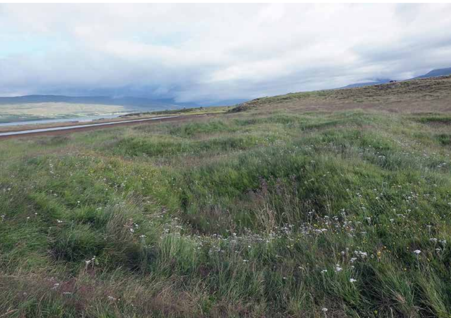
Figur 4.2: Gásir, Eyjafjörður, på Nord-Island. Likhetene med Skonsvika er besnærende.

I utgangspunktet virker kanskje Nord-Atlanteren som en uoverstigelig barriere for spredning av ideer om byggeskikk til Finnmark i mellomalderen. Det er likevel dette som trolig var tilfelle. Historiske kilder viser nemlig kontakt mellom Island og finnmarkskysten i mellomalderen. I