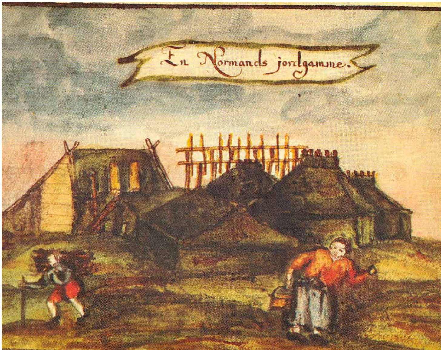
Figur 4.4: Lilienskiolds akvarell av sammenbygde (?) hus i en såkalt nordmannsgamme.

Sammenhengen mellom mangeromshus og fiskeværenes tidlige arkitektur er foreløpig usikker. Det som taler for en relasjon er at personell har sirkulert mellom fiskevær og steder med mangeromshus i mellomalderen, og formidling av innovative byggemetoder har trolig vært en naturlig del av samhandlingen. Folk som bygde hus på flere steder i løpet av sin levetid, har trolig benyttet like bygningstyper hver gang de bygde hus et nytt sted, og samtidig formidlet ideer om byggemetoder på tvers av regioner. Selv om bygningene ble modifiserte gjennom tidene, kan kanskje noen grunnleggende prinsipper bak mangeromshusene ha overlevd i Finnmark opp mot moderne tid.