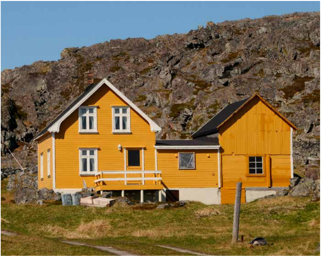
Figur 4.6: Varangerhus i Hamningberg, Båtsfjord kommune.

Kanskje kan elementer av denne byggeskikken ennå spores etter at trehusene ble vanlig blant allmuen i Øst-Finnmark utover 1800-tallet. Det såkalte Varangerhuset er et hus der våningshus og fjøs er bygget sammen, kun adskilt av gang og dør. Det ble dermed mulig å se til dyrene uten å måtte bevege seg utendørs. Opphavet til Varangerhusene er forklart med klimatilpasning, inspirasjon fra hustyper folk i Øst-Finnmark allerede kjente til, som den samiske fellesgammen og/eller trehus ved Kvitsjøen, særlig blant karelerne. Alle disse teoriene kan være med på å forklare oppkomsten av hustypen, den ene utelukker ikke den andre.