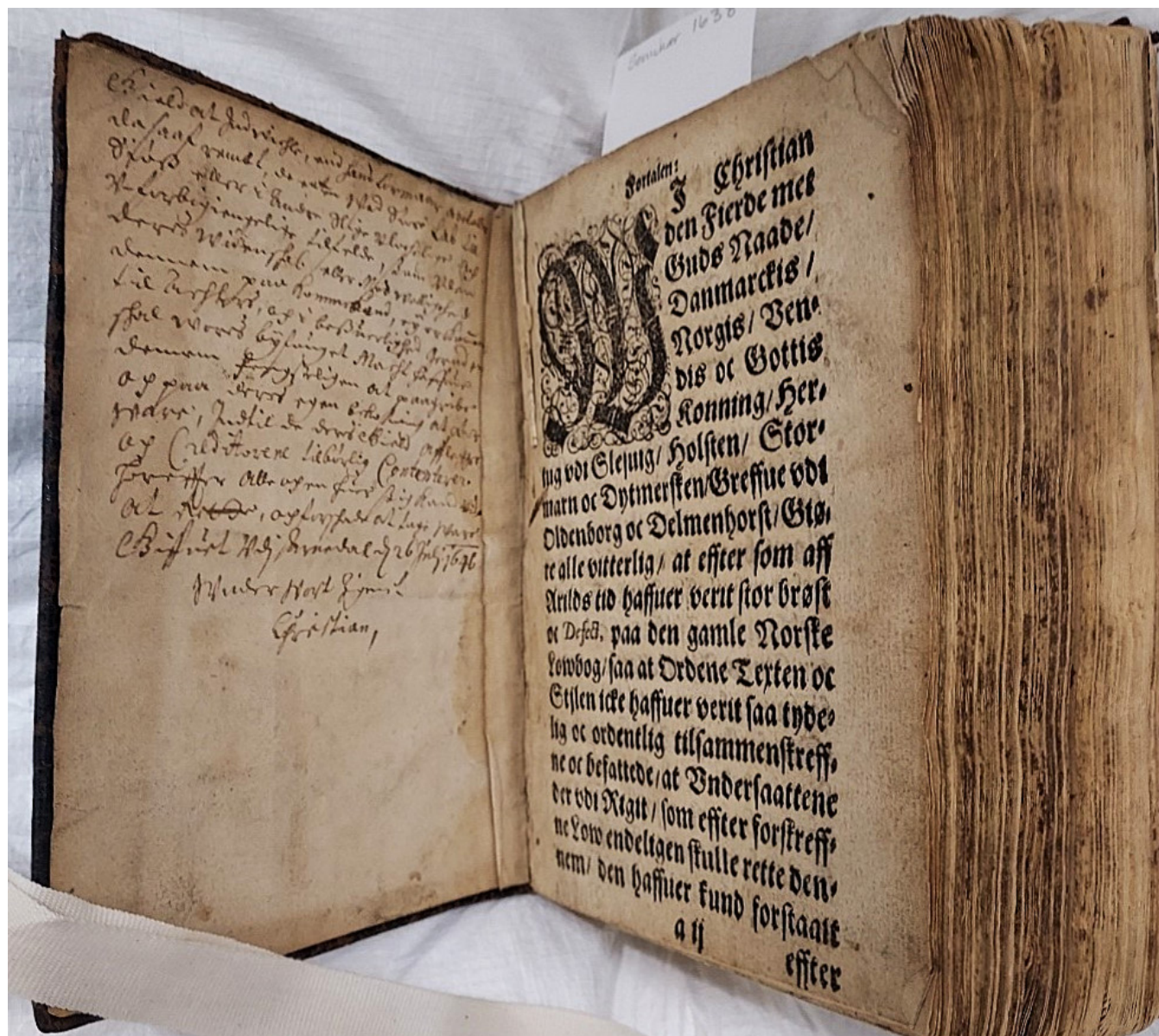
Figur 4. Seminarets eksemplar av Den Norske Low-Bog med tallrike antegnelser. Tittelsiden mangler fullstendig.

Samlingsutvikling er en vesentlig oppgave ved ethvert bibliotek. Bortsett fra tilstandsvurdering og eventuell istandsetting av de bøkene som allerede er en del av samlingene, innebærer dette også innkjøp av relevant litteratur og kassasjon av skadede eller irrelevante bøker. Biblioteker er dynamiske systemer der inventariet forandres over tid. Ikke alt bør eller kan bevares og kassasjon, altså det å gi bort eller kaste utgåtte bøker, må til for å kunne benytte begrensede ressurser på en meningsfull måte. Det er trygt å si at noen av de eldste bøkene