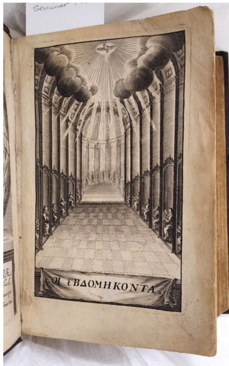
Figur 5. Frontispisen av Seminarsamlingas nest eldste bok, ei utgave av Det gamle testamente på gresk.

Hovedmålet med Trondenes seminarium var å utdanne lærere til den samiske befolkninga i nord. Det var avgjørende at uteksaminerte kandidater kjente til landsdelens historie og geografi. Det er derfor klassikere som Gerhard Schønings (1722–1780) avhandling om samene er del av