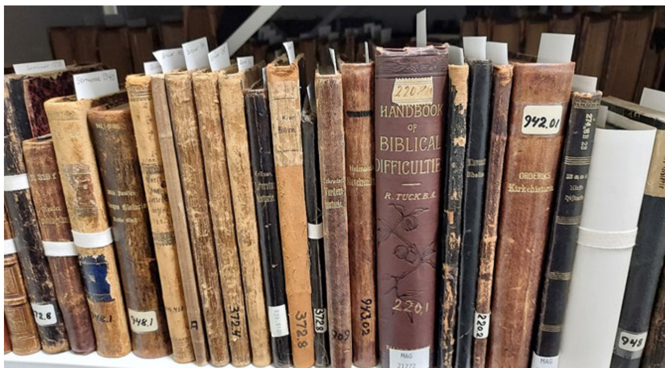
Figur 1. Seminarsamlingas bøker bærer preg av å ha blitt omklassifisert flere ganger.

Undervisningen foregikk i en skrøpelig bygning som lå mellom kirken og prestegården, og som i henimot 200 år hadde vært skolestue for konfirmantene. Bygningen var 19 alen lang, 8\frac{1}{4} alen bred og 5\frac{1}{2} alen høy, og hadde med andre ord en grunnflate på knapt 62 m 2 . Her var innrettet 2 værelser, kjøkken og gang. Det ene av værelsene med en gulvflate på 23 m 2 og en takhøyde på 2 m., var innrettet til klasserum. De øvrige rummene var leilighet for annenlæreren. Fra gangen førte en stige opp til loftet, hvor høyden under taket var 2 alen på det høyeste. Midt på loftet var seminaristenes matkister stablet opp og på begge sider hadde elevene sine soveplasser. Noen oven fantes ikke på loftet, og det er ikke å undres over at kulden