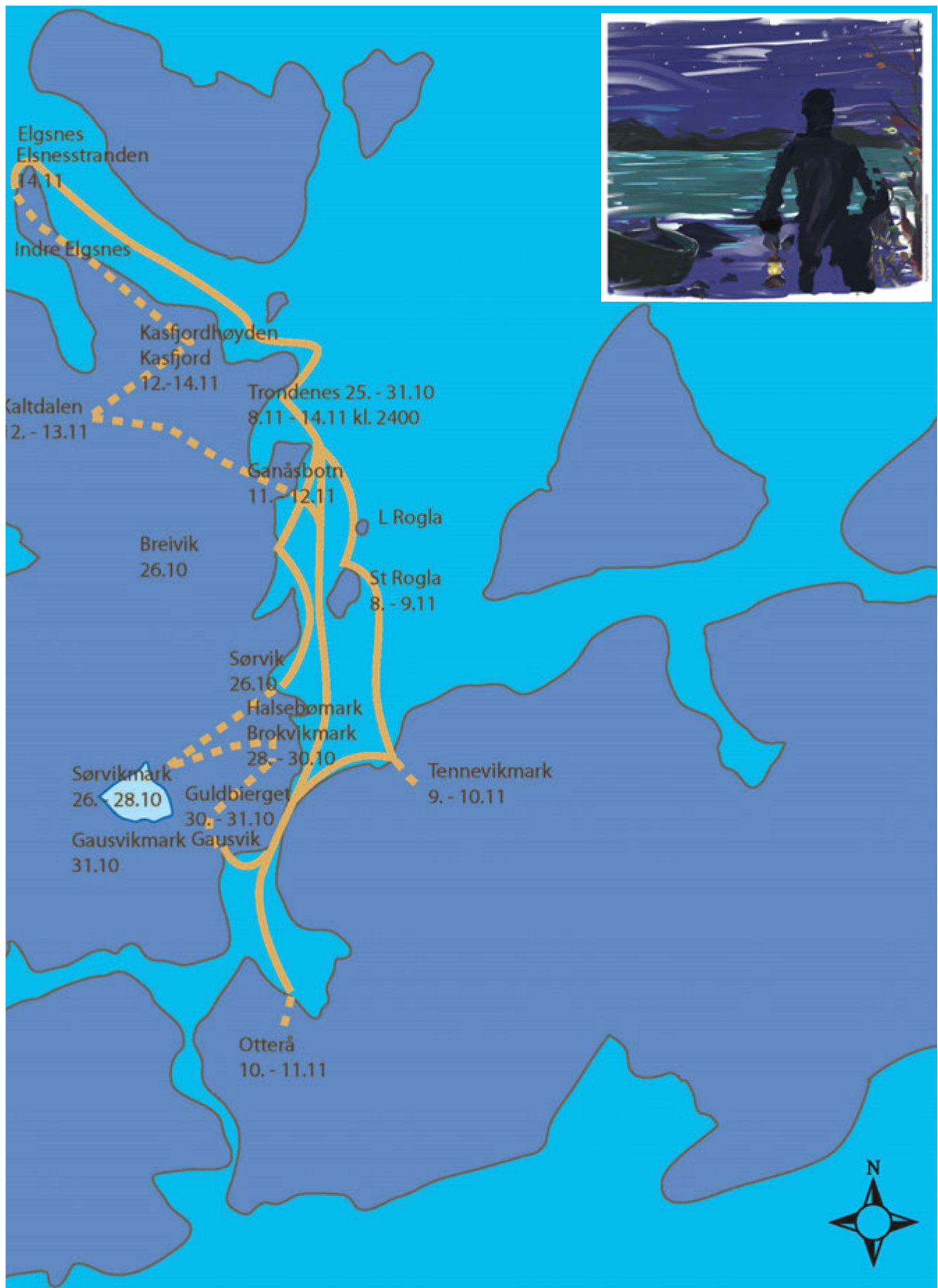
Figur 4. Illustrasjon av Burchards reise i Sør-Troms i 1721. Illustrasjon Dikka Storm og Ernst Høgtun