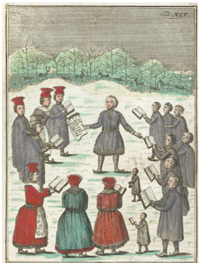
Figur 1. Preken under åpen himmel. Fra Universitetsbiblioteket i Tromsøs fargelagte eksemplar av Knud Leems Beskrivelse over Finmarkens Lapper .

I tillegg var det et politisk aspekt med misjonen, siden grenseforholdene til Sverige og Russland fortsatt var uklare, med fellesområder der samene