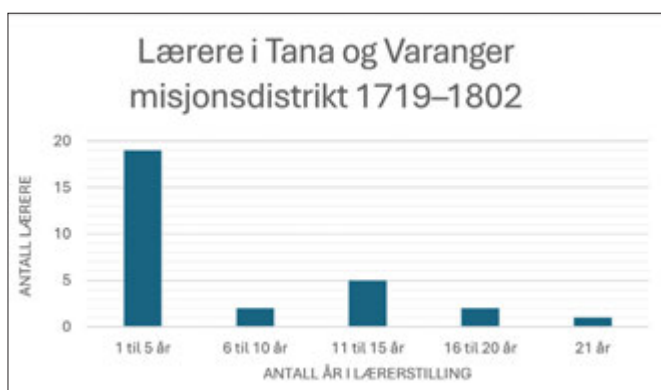
Figur 2. Lærere i Tana og Varanger misjonsdistrikt 1719–1802. Diagram utarbeidet av S. Rasmussen.

Det må ha vært et betydelig antall lærere som arbeidet i misjonens skoler. Læreryrket blir likevel ikke beskrevet som spesielt ettertraktet, noe som kan ha sammenheng med både lønnsvilkårene