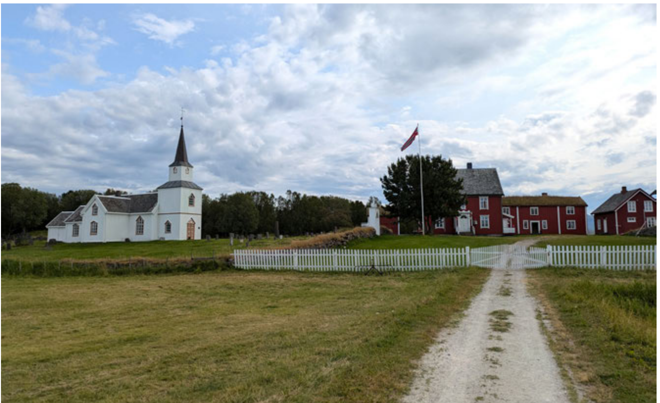
Figur 5. Tranøy kirke og prestegård.