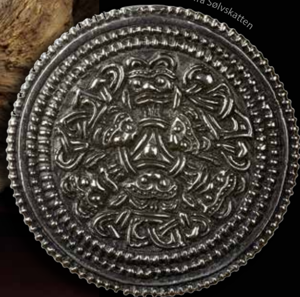
Foto: June Åshelm@Tromsø Museum – Universitetsmuseet • Foto: Solvskatten: Torunn Marie Røed, TMU Layout: Ernst Höglin@Tromsø Museum – Universitetsmuseet

Lars Thøringsvei 10, 9006 Tromsø • Tlf 77 64 50 01 • shop@tmu.uit.no