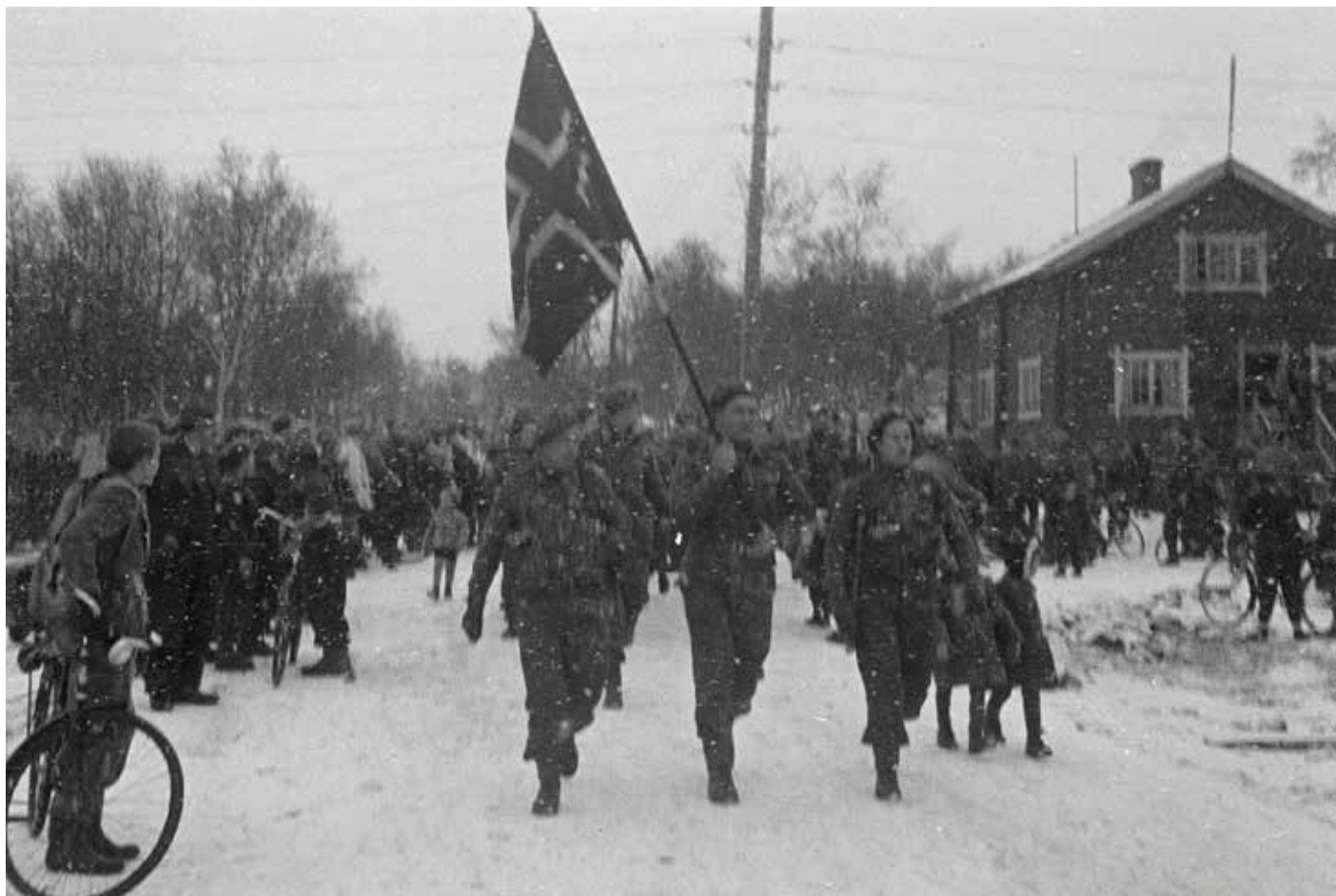
En forventningsfull befolkning i Bjørnevatn tar imot 2. bergkompani fra Skottland den 11. november 1944.