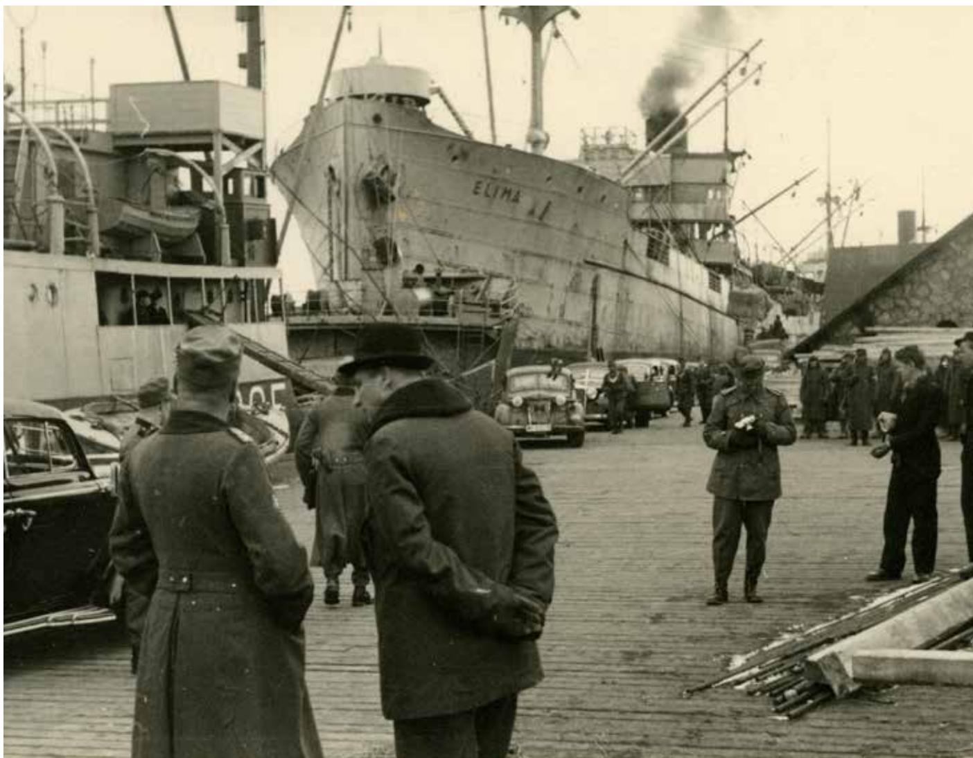
Kirkenes var sentrum for forsyninger til Petsamo og Litsafronten og for utskipping av norsk jernmalm og finsk nikkel. Her besøker Rikskommissariatets leder i Kirkenes havna. Sovjetiske krigsfanger i bakgrunnen.