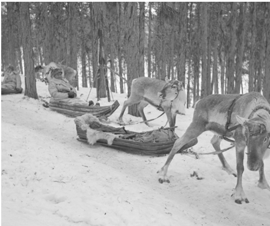
Skyss med rein var ettertraktet blant tyskerne.

Rasebaserte interesser og rasehygieniske oppfatninger var å finne blant høyere offiserer. Det mest kjente eksempelet, generaloberst Eduard Dietl, fulgte den nazistiske raseideologien og etablerte av rasehygieniske årsaker et forbud mot ekteskap mellom tyske soldater og norske kvinner. På dette tidspunktet, i desember 1943, var det ikke lenger