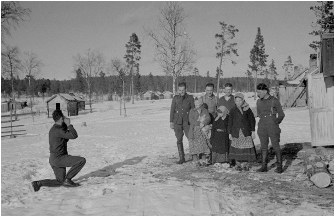
Tyskerne hadde en base i Suonikylä, Petsjenga. Soldater har samlet lokale beboere til fotografering.

helbredende kilde til helse og en motgift til den urbane dekadansen. Naturbundet primitivisme hadde flere positive, kraftdannende og identitetsbærende konnotasjoner i tysk tenkning. Den nasjonalsosialistiske bevegelsen delte bekymring for helsen til det tyske folket. For