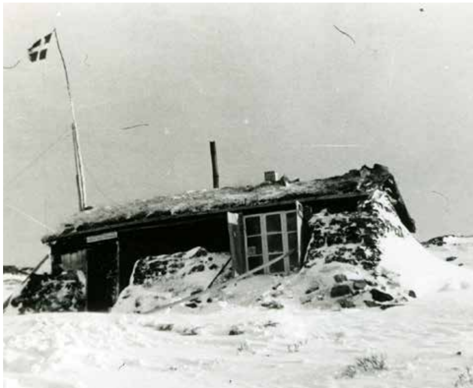
En av to hytter som utgjorde basen Sepals II, også kalt Anna. Den lå ved Unna Allakas fjellstue nær Skjomen og Beisfjord.

I Ofoten og Indre Troms var det norske militære fotavtrykket mye mer solid fra starten av. De to eneste komplette enhetene av hjemmestyrkene som ble opprettet i Nord-Norge, var i Bardu og Målselv. På forhånd var 200 mann utpekt, og de fikk våpen og ble ledet av offiserer med tilknytning til