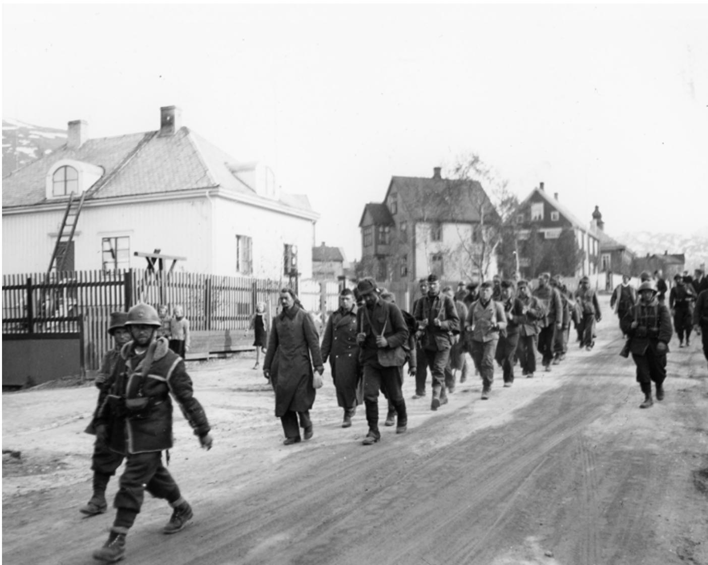
Tyske krigsfanger etter gjenerobringen av Narvik. Her marsjeres de gjennom byen 29. mai vaktet av polske soldater.