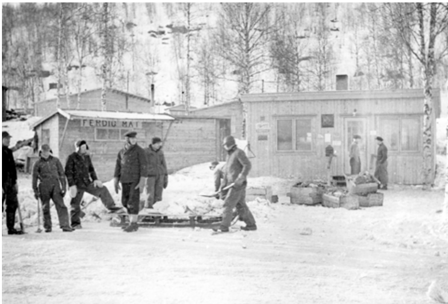
Norske bygningsarbeidarar ved Bardufoss flyplass i 1942. I bakgrunnen eit provisorisk postkontor og kolonialforretning.

Med den NS-innførte nyordninga av kommunane i januar 1941, skulle dei bli eit reiskap for nazifisering der førarprinsippet skulle gjelda. Det vart gjennomført, men i praksis var det ikkje så lett å få til endringar i kommunepolitikken. NS klarte ikkje å fylla alle ombod, og i byane heldt dei administrativt tilsette stort sett fram som før. Men krigskonjunkturane – og krigshandlingane – gjorde at kommunane kom i ein heilt annan stilling enn før krigen. Kommunane i Nord-Norge sleit endå tyngre enn i landet elles i mellomkrigstida, fordi dei økonomiske og sosiale