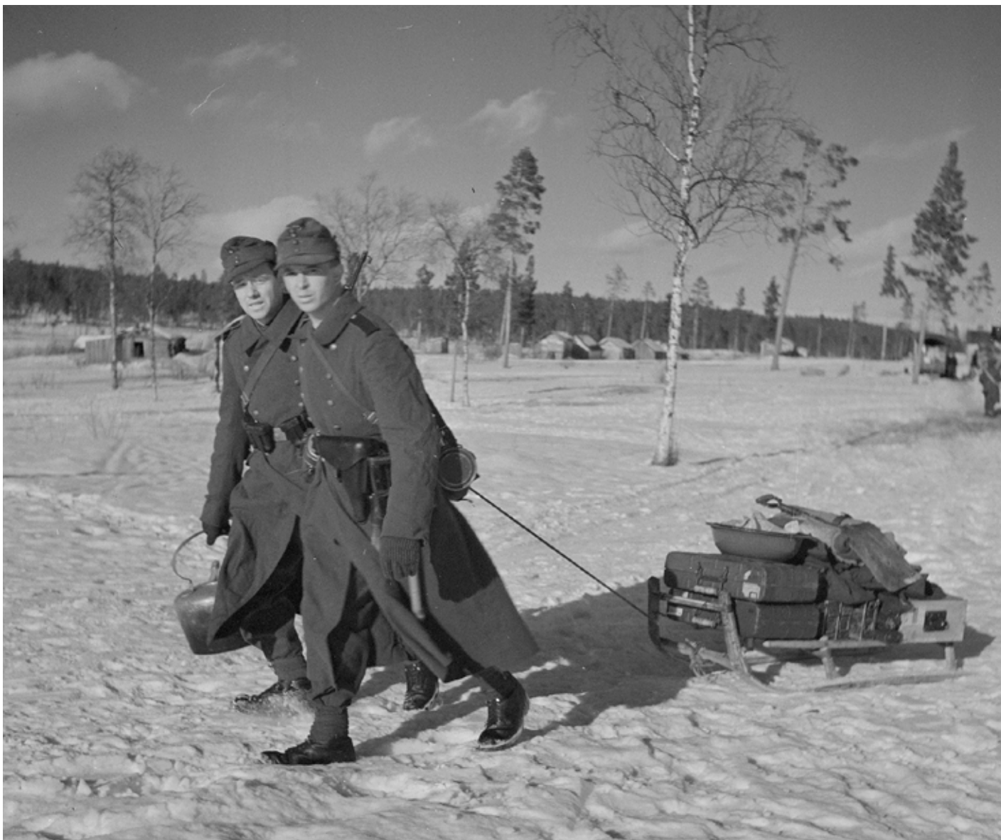
I Suonikylä lærte tyskerne å bruke skoltesamiske redskaper. Her en lett kjelke.