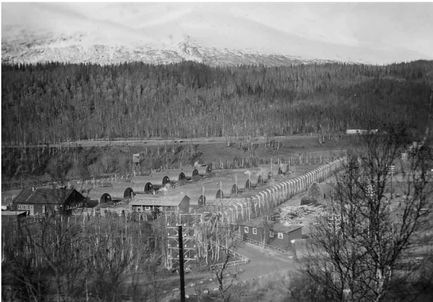
Storvoll arbeidsleir i Rana for sovjetiske, polske og jugoslaviske krigsfanger som arbeidet på Nordlandsbanen.