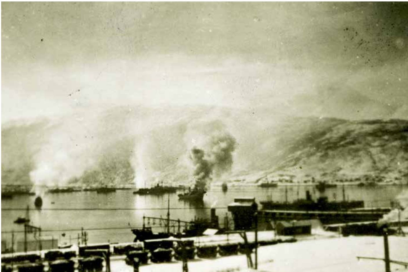
Skip i brann på havna i Narvik etter angrep av britiske marinestyrker 10. april 1940.