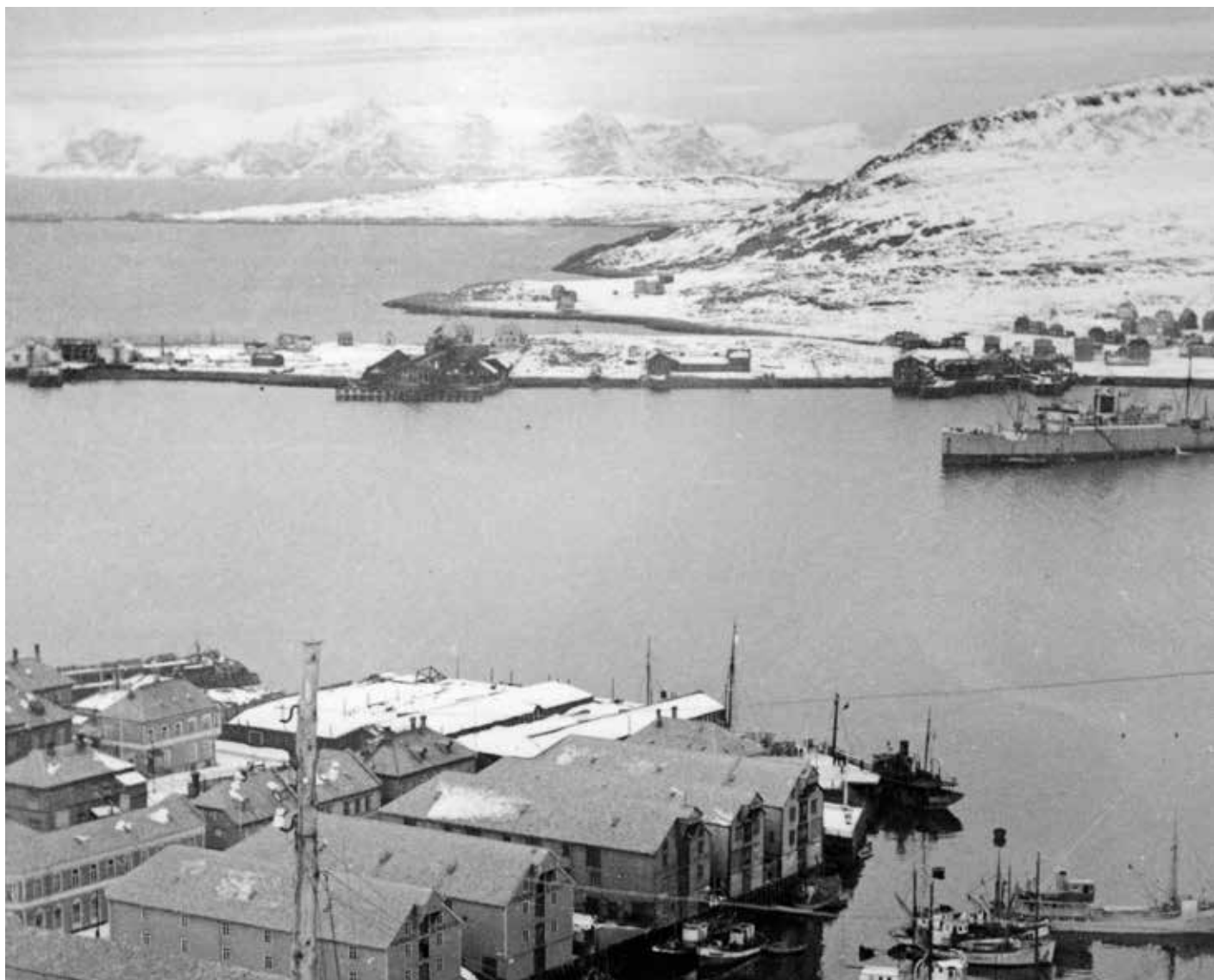
Hammerfest havn seinhausten 1940. Til høgre i biletet ligg den tyske flytande filetfabrikken D/S Hamburg.