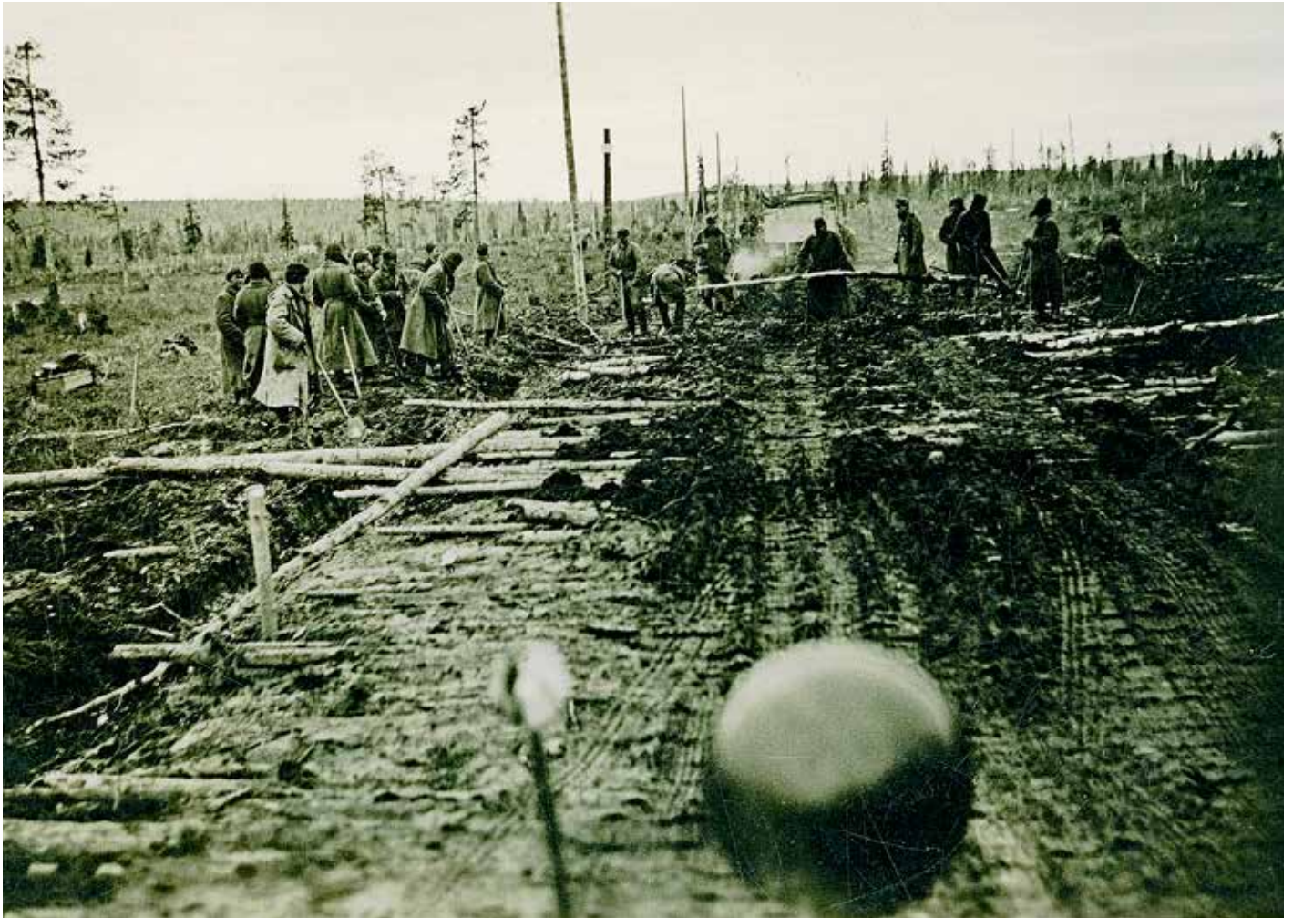
Store veiprosjekter ble igangsatt av tyskerne både i Nord-Norge og i Nord-Finland. Her er sovjetiske krigsfanger på veiarbeid i Nord-Finland.

For å hindre at nordmenn hjalp de sovjetiske krigsfangene, satte norske politimyndigheter inn kunngjøringer i avisene om forbud mot å omgås