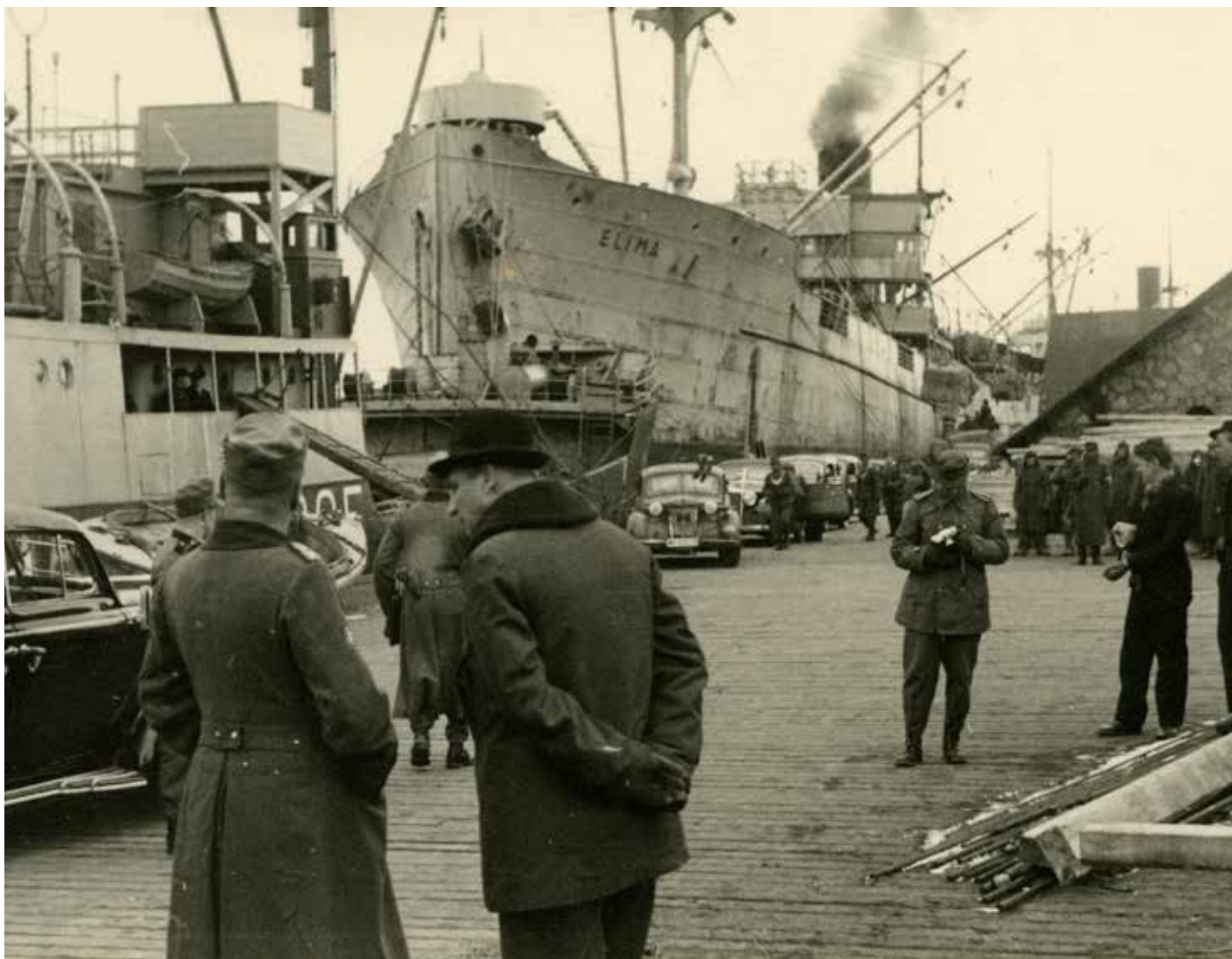
Kirkenes var sentrum for forsyninger til Petsamo og Litsafronten og for utskipping av norsk jernmalm og finsk nikkel. Her besøker Rikskommissariatets leder i Kirkenes havna. Sovjetiske krigsfanger i bakgrunnen.