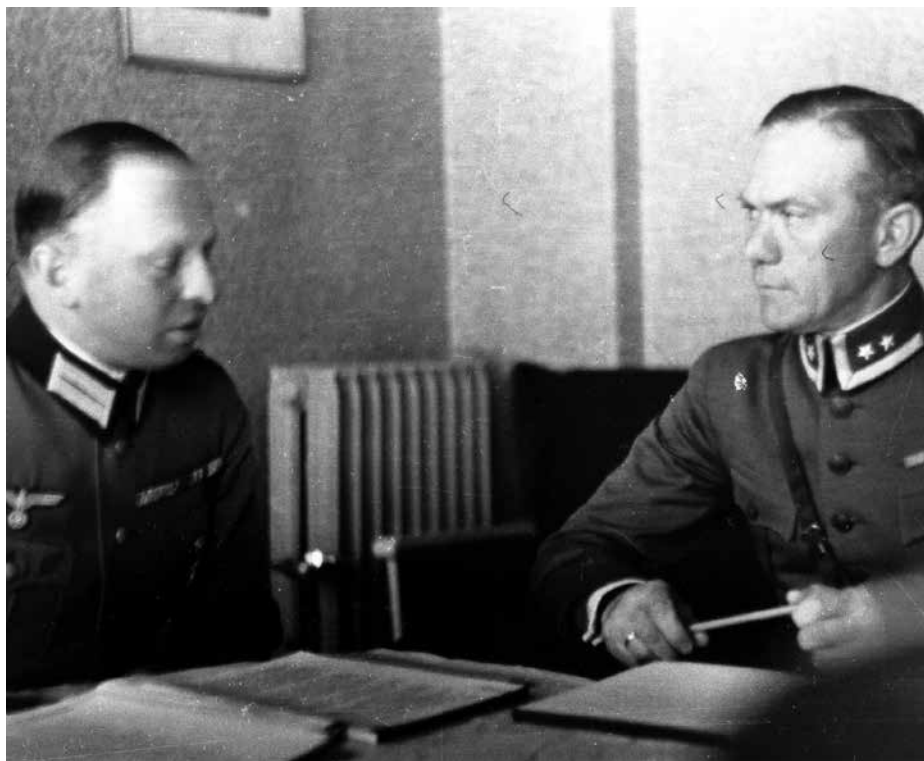
Forhandlinger om kapulasjonsavtalen i Trondheim 10. juni 1940. Den tyske obersten Erich Buschenhagen (t.v.) og den norske oberstløytnanten Ragnvald Røschner-Nilsen.

Samtidig med at de allierte planla og gjennomførte sin evakuering, fortsatte de norske styrkene å kjempe i fjellene nord-øst for Narvik. Planen var at 6. brigade skulle rykke frem langs svenskegrensen mot jernbanen, mens 7. brigade skulle rykke frem vest for dem. Fra 30. mai og i løpet av de neste dagene ble den tyske styrken presset stadig mer sammen mot