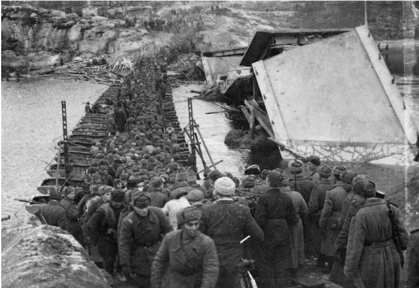
Sovjetiske tropper går 24. oktober 1944 over Pasvikelva på en nylagt pongtongbro og rykker neste dag inn i Kirkenes.