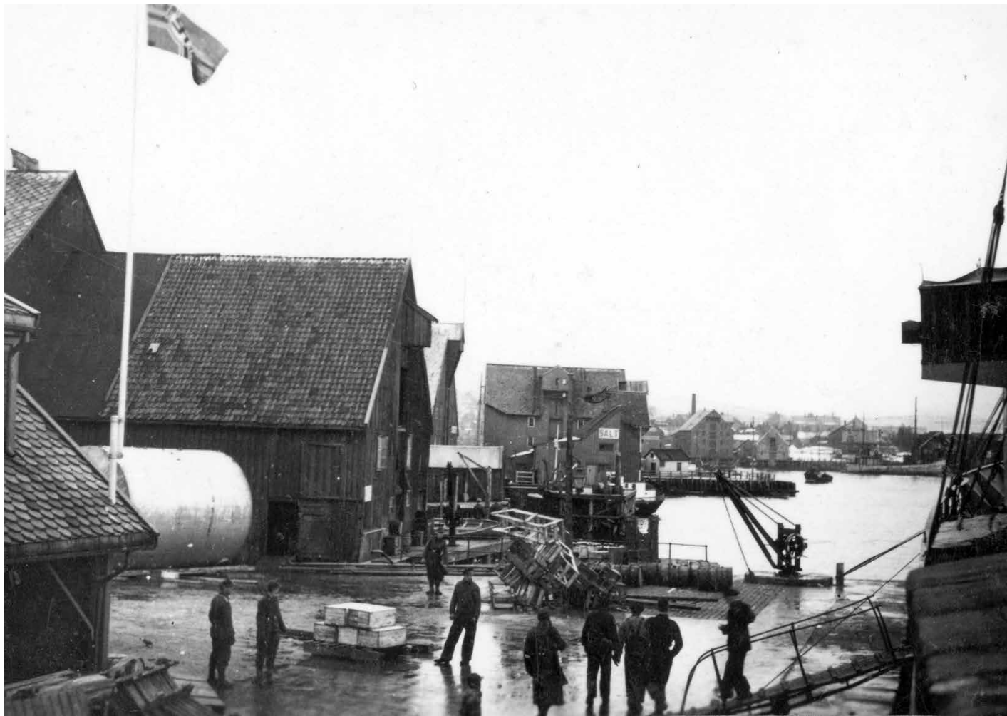
Tyske soldatar og norske arbeidarar på ekspedisjonskaia i Tromsø.