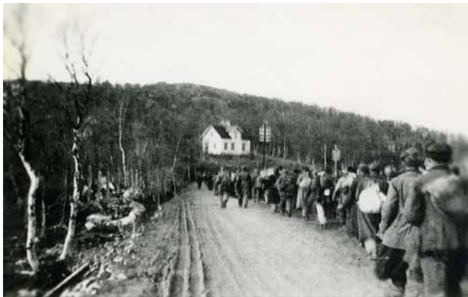
Kolonne med sivile, trolig østarbeidere eller tvangsutskrevne fremmedarbeidere, på marsj sørover i 1944. De blir fulgt av væpnede vakter.

rasjoner for sovjetiske krigsfanger bak frontlinjene eller innen riket ville medføre et for sterkt press på tilgjengelige mattilførsler i Tyskland. Han fryktet at resultatet ville bli en reduksjon i rasjonene til den tyske befolkningen eller de tyske militære styrkene. Men prioriteringen var snarere en form for rasjonalisering, basert på tyske myndigheters beslutning om tilintetgjørelse av visse grupper mennesker. Wehrmachts egne beregninger viste at det var nok mat tilgjengelig til å holde både tysk befolkning og krigsfangene i live. Men – i de okkuperte områdene var det bare de som arbeidet for tyskerne, som var garantert mat.