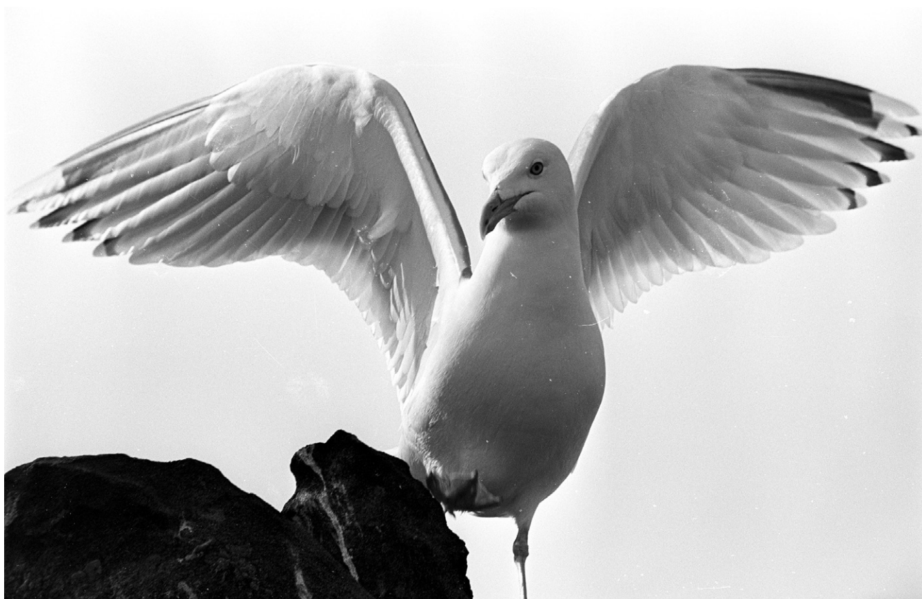
I sittende positur slår gråmåsen vingene ut, slik Finnmarks-kvinnen så den fra kjøkkenvinduet.

låvebrua? Ba måsen henne om hjelp? Kvinnen bestemte seg straks for å bistå. Først fant hun fram en kjele fra kjøkkenskapet. Så satte hun kjelen på hodet som beskyttelse, før hun snek seg ut ytterdøra og bevegde seg forsiktig over gårdsplassen, i retning låven. Framme ved låvebrua stavra hun seg forsiktig ned på kne, fortsatt med et godt grep om kjelen på hodet med den ene hånda. Måsen klagde over henne, men holdt seg litt på avstand. Jo da, der romsterte det en måsekylling under bordplankene. Kvinnen stakk den ledige handa ned i ei sprekke og lirka kyllingen ut, før hun raskt slapp