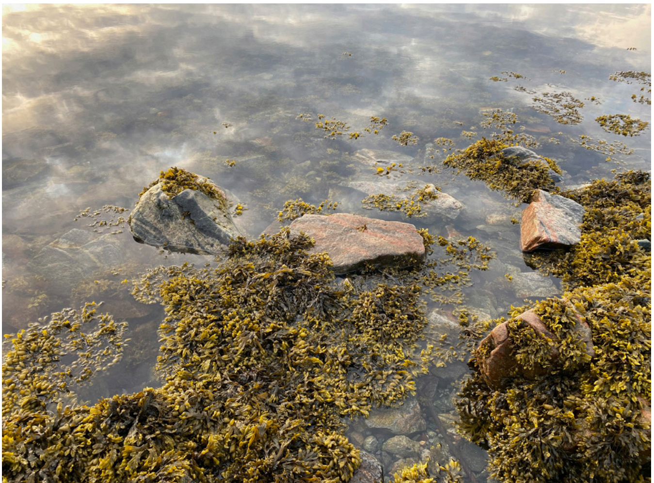
Fjæra har fått nytt liv som sted for å sanke mat.

«Jeg har sluttet å drepe mygg, jeg børster dem bort», fortalte en eldre mann i Finnmark meg nylig. I likhet med mange i sin generasjon, har han