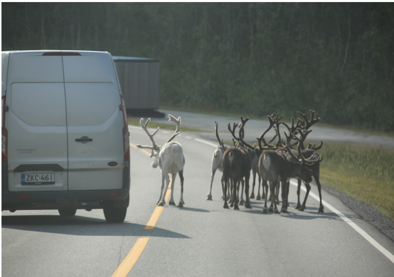
Rein i veien?

Denne artikkelen, basert på tilgjengelig forskning, har vist til tidligere tiders statsannektering av samisk grunn og kultur. Også i dag er resultater fra disse prosessene en del av gjeldende samfunnsorden og rettspraksis. Vi har vist til de retoriske og maktbaserte grepene staten i sin tid foretok seg, og som gjorde samiske reindrivere, egentlig hele Sápmi, herreløse på egen grunn og i egne områder. Staten har i ettertid utnyttet sin eierposisjon til å gi plass til bønder, industriaktivitet, stedsutvidelser, hyttefelt og friluftsliv. Reinbeiteområdene er gjennom dette blitt redusert. Altså, først gjorde man reinbeitene om til felleseie, og så ga man andre tilgang og eierskap til deler av områdene. Dette er prosesser som fortsatt pågår, understøttet av virkelighetsoppfatninger og kunnskapsregimer som ofte kolliderer med de reindriften og andre samer besitter. Allemannsretten, som tidligere ble kalt «uskyldig nyttesrett», gjorde norske – også samiske – utmarksområder tilgjengelige for alle. I våre dager framstår denne retten langt fra som uskyldig. Særlig tar aktivitetene plass, friluftslivets