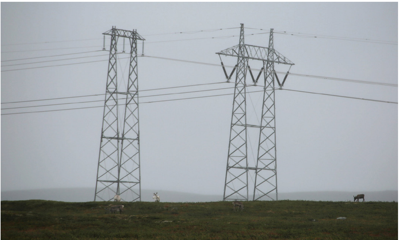
Moderne reindrift: foring og industrielle utfordringer.