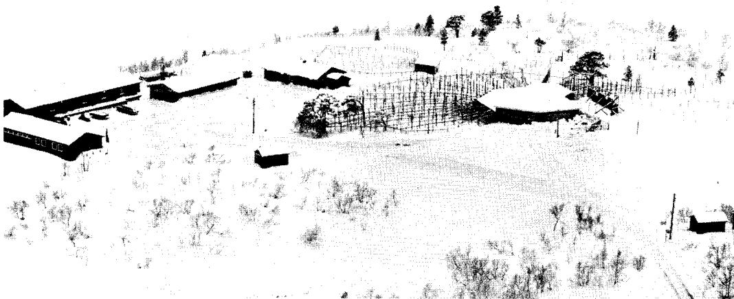
Den norske reinforsøksstasjonen på Lødingen, nå nedlagt.