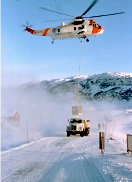
Bilde 5. Moskusokse i kasse under forswarets Sea King på vei til Alta for videretransport til København med C-130 Herkules.

Figure 5. A muskox bull hanging in a crate under a Royal Norwegian Air Force rescue helicopter for subsequent transport from Alta to Copenhagen with a C-130 Hercules transport aircraft.