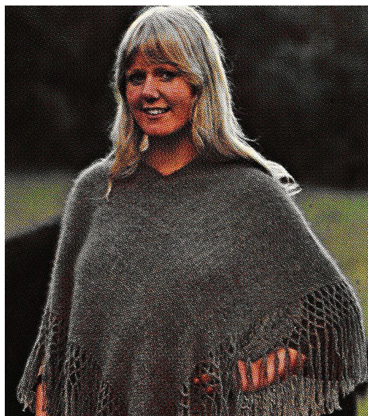
Bilde 3. Et eksempel på de mange klesproduktene som ble markedsført; her et sjal.

Den 21. november 1972 ble det søkt om konsesjon for kjøp av tilleggsjord fra Øyang 37/20 og Øilien 37/16. Samme år ble det omsider kjøpt en brukt traktor til erstatning for den avfaldige Jeepen og fra nu av ble det hver sommer ansatt hjelp i tillegg til bestyreren og frivillige mannskaper og driften av kafeen ble startet opp på utleiebasis.