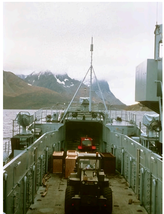
Bilde 6. Overføring av 8 moskuskyr fra Årøya til Rya med KNM Reinøysund 1. oktober 1981.