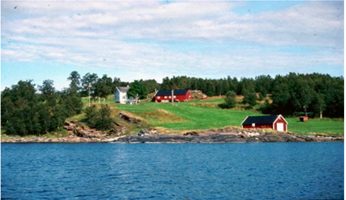
Bilde 7. Fra Rya-eiendommen utenfor Tromsø. Figure 7. Part of the Rya-property of the University of Tromsø.