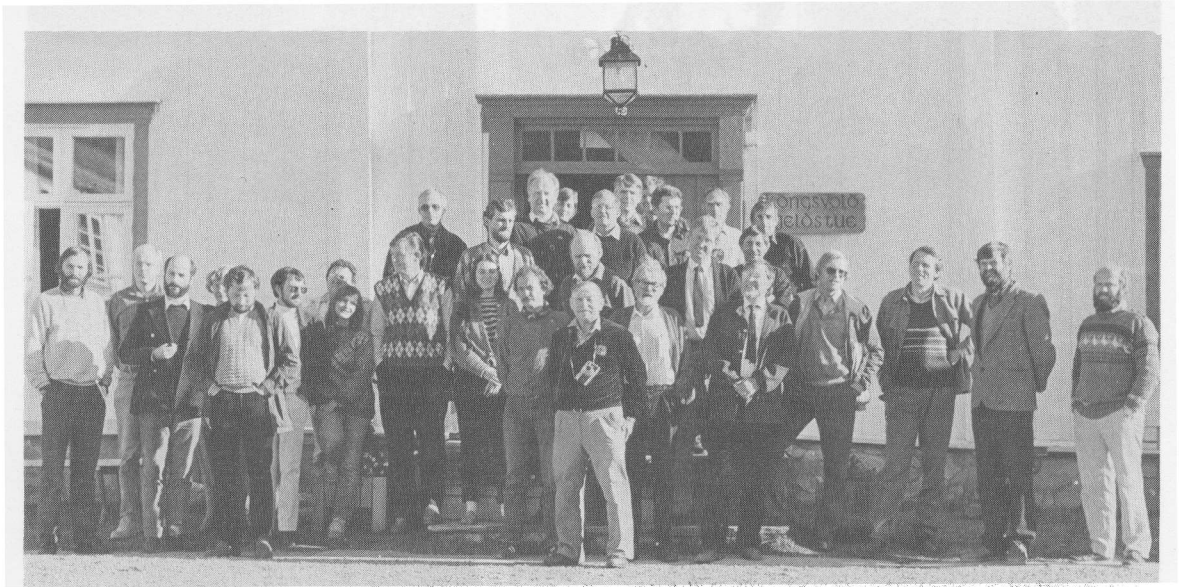
Trettien individualister i solveggen på Kongsvold