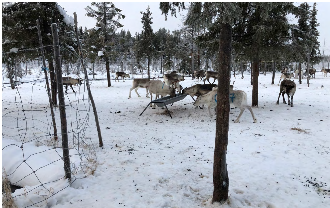
Figuvra 3. Dálvebiebman áiddis beahcevuovddis Davvi-Ruotas.

Suomas eará eanangeavaheami, nuppástuvvi dálkkádaga ja boraspiriid váikkuhusat leat dehálepmosat bohccuid dálvebiebmama sivat. Vuovdedoallu, turisma ja málmmaohcan ja ávkin atnin leat lassánan ja dahkan váddásabbon eatnama geavaheami bohccuide guohtuneatnamin. Stuorra oassi vuvddiin leat čullojuvvon 1960-logu maŋná, ja jeageldálveguohtumat, dego boares meahcit, main muoraid ovssiin šaddet ollu jeahkálat, leat billašuvvan ja daid mearri lea geahppánan ja kvalitehta hedjonan mearkkašahttiláhkái. Bohccuid dálvebiebman sihke guohtuneatnamiidda ja áiddiide lea dábálaš olles boazodoalloguovllus. Sámiid ruovttuguovllus, gos bálgosat leat stuorábut go Suoma máttimus bálgosat, oassi boazodoalliin doallá ealuidis