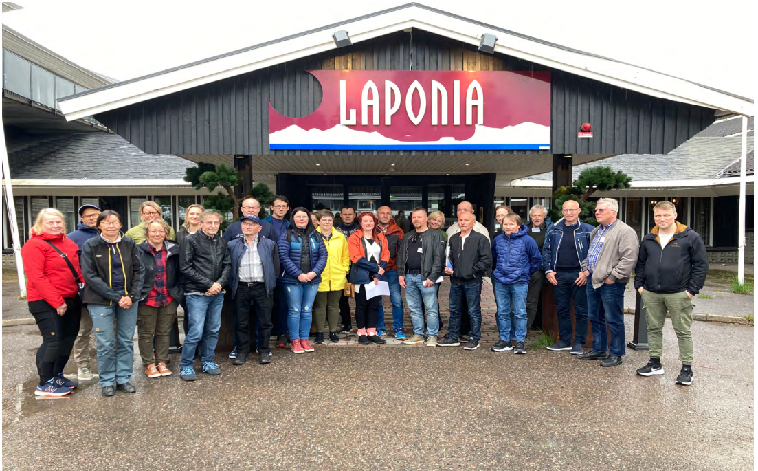
Figuvra 1: Buot Árvvesjávrrri bargobáji oassálastit 8.–9.6.2022