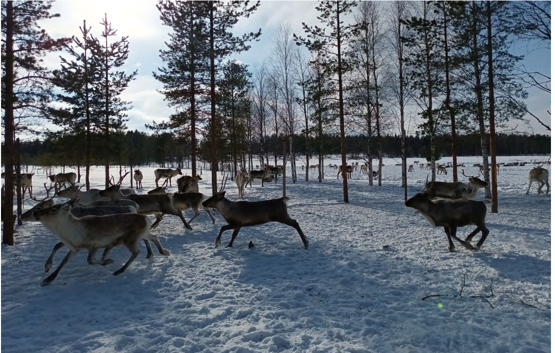
Figuvra 5. Biebman “rabas gárddis” ovttá biebmansajiin áiddiin birrasis vai duvdá bohccuid guohtungovolluide gosa lea sieddu (dábálaš Suomas). Bohcco besset iežat biebmansaji ja guohtuma gaskkas.