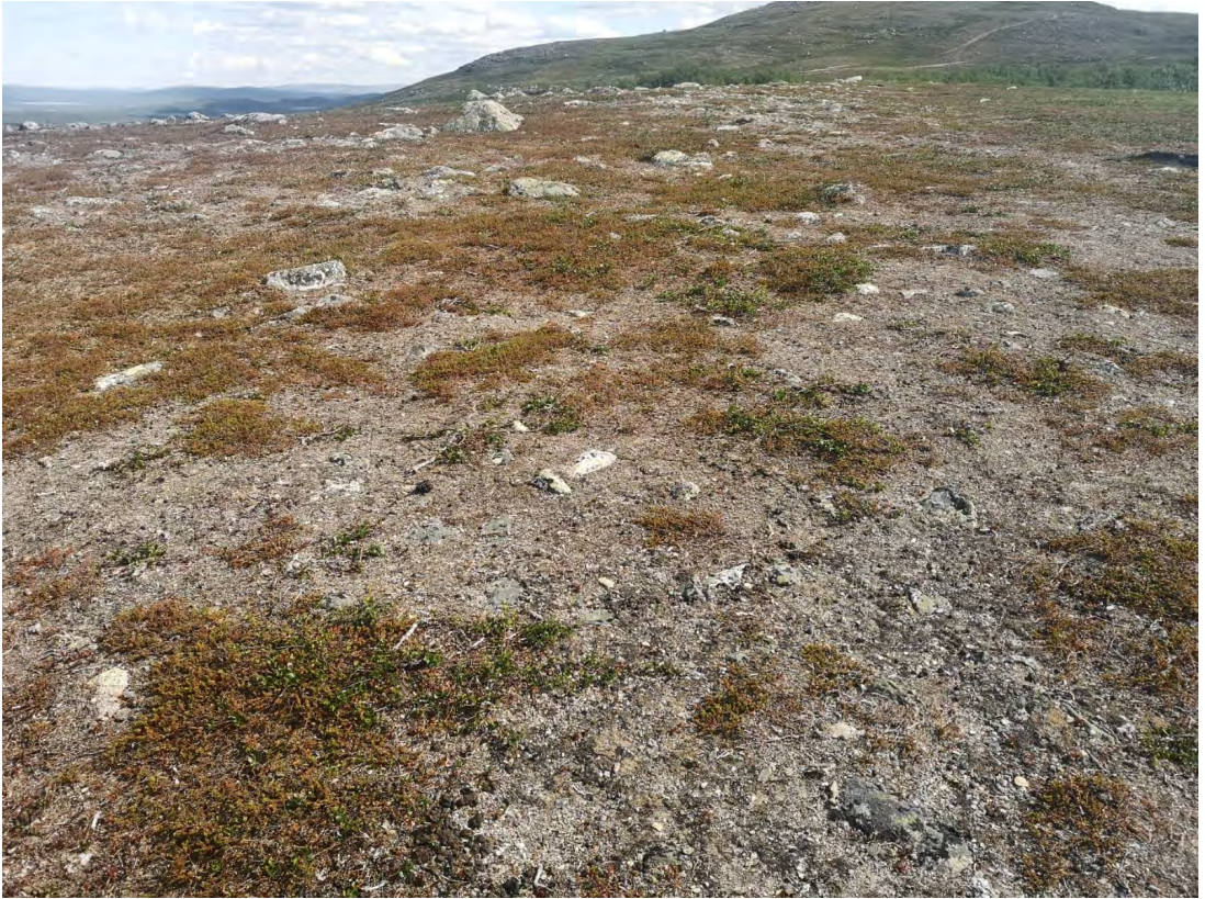
Figvra 10. Ovdamearka Davvi-Ruota duoddaris, gos bohccuid leat biebman dálvit guohtuneatnamiidda.