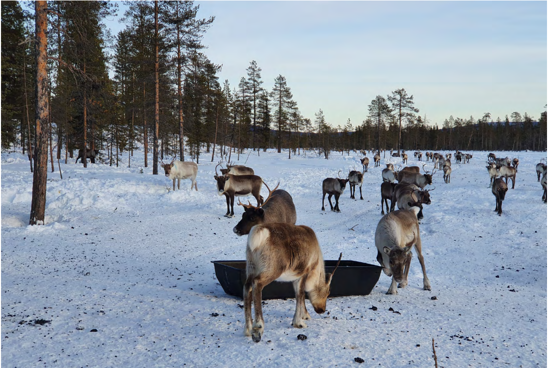
Figuvra 7. Dálvebiebman guohtuneatnamiidda meahcis.

goittotge kivrot ja sáhttet joatkit čiegardeami, vuoikko muohtadilli livččiige váttis.