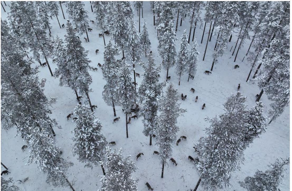
Figuvra 6. Dálvebiebman guohtuneatnamiin meahcis, dás bohccuin leat láhput.