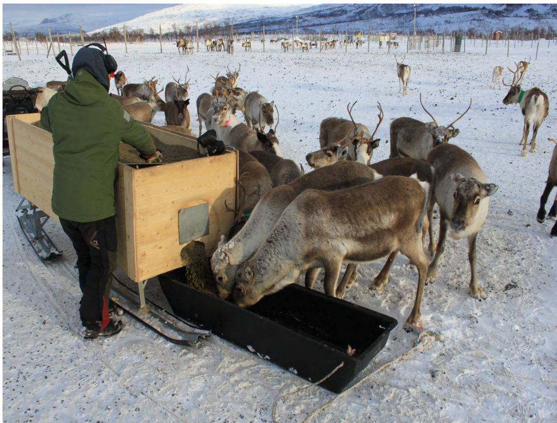
Figuvra 4. Dálvebiebman áiddis duottarguovllus Norggas.

”Ránnjáčearru mii lea biebman olles dálvviid njggaid jagiid. Jus min bohccot čužžot ja goivot de dat nuppit dušše vázze meaddel ja eai bisán goaivut. Luondu rievdá bohccuin mat leat bib-