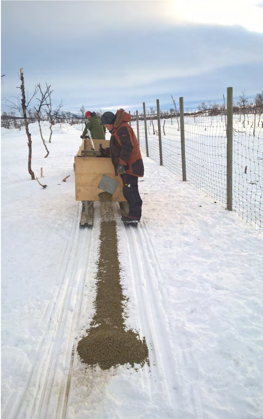
Figuvra 8. Biepmat šalkkas go biebma njuolga guohtuneatnamis sáhtta leat buorre. Bohccot ožžot čázi buhtis muohttaga bokte mii guoská fápmofuodđara. Dasa lassin fuodar ii duolvva go bohccot goivo fuodđaris.