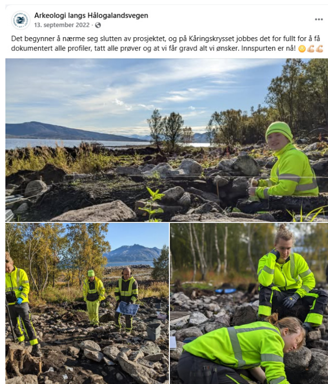
Figur 1 Eksempel på Facebook-oppdatering fra felt. Skjermdump tatt 12.11.2025.

I feltesongen oppdaterte vi sosiale media en til to ganger i døgnet, hovedsakelig med funn, små glimt fra feltarbeidet og mer beskrivende innlegg (Figur 1). Vi laget også filmer, både rettet mot barn og mot et voksent publikum. Formidlingen