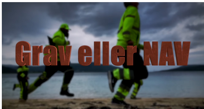
Figur 2 Forsiden på serien Grav eller NAV.

ansatte på dette, og det var mye moro med å lage disse seriene.