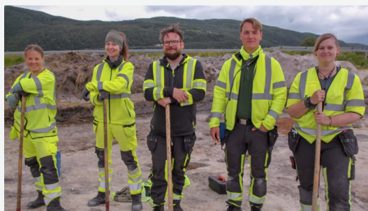
Figur 4 Medieinnslag om prosjektet. Her fra NRK og Harstad Tidende. Skjermdumper tatt 12.11.2025.