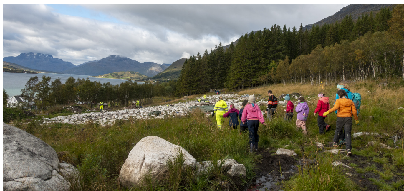
Figur 3 Skoleklasse på omvisning på Solli i 2021.

I perioder der koronatiltakene tillot det, og i løpet av den siste feltlesongen hadde vi skoleklasser på besøk (Figur 3). Barn fra Lødingen