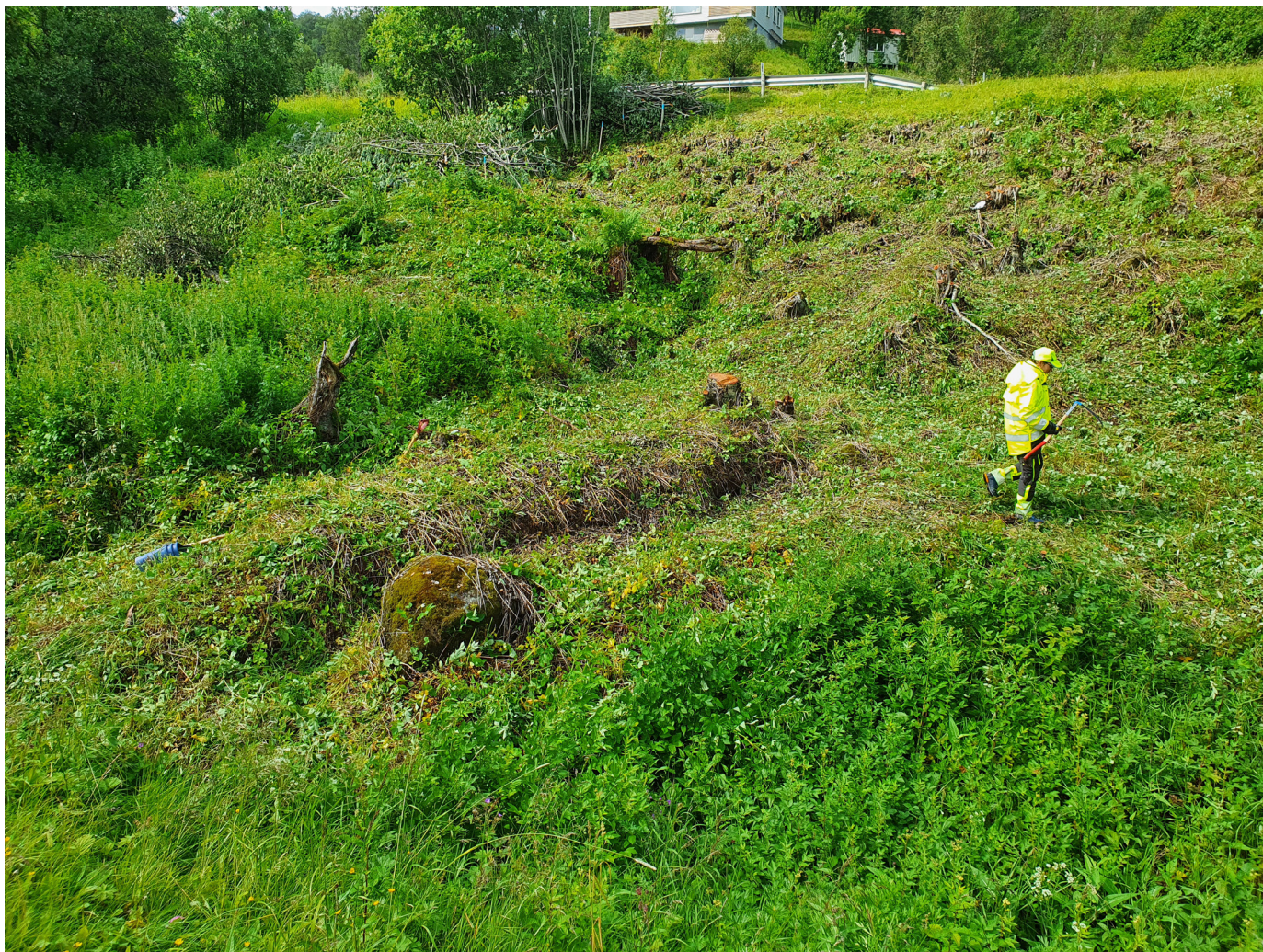
Figur 2 Gjerdet etter vegetasjonen er ryddet