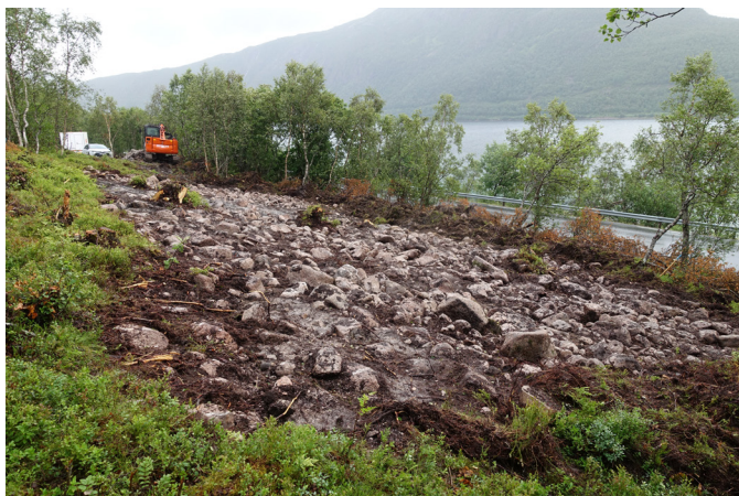
Figur 2 Avtorvet område på Sommerset

stigende terreng med ur og berg og fjell, bevest med bjørkeskog opp til snaufjellet. Den lokale topografien i området preges av overganger mellom fjell, li og sjø, relativt jevnt stigende opp mot snaufjell, uten noen store strandterrasser.